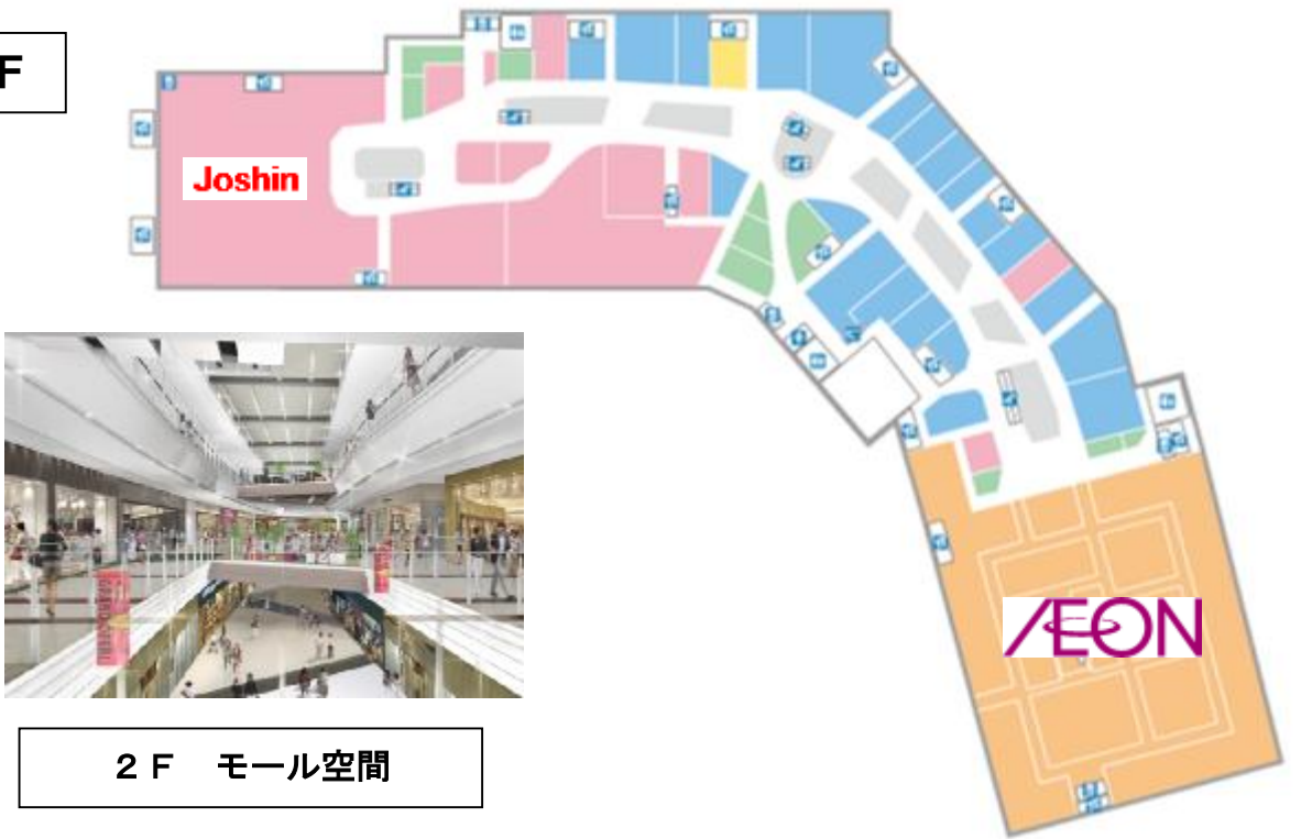
2 F モール空間