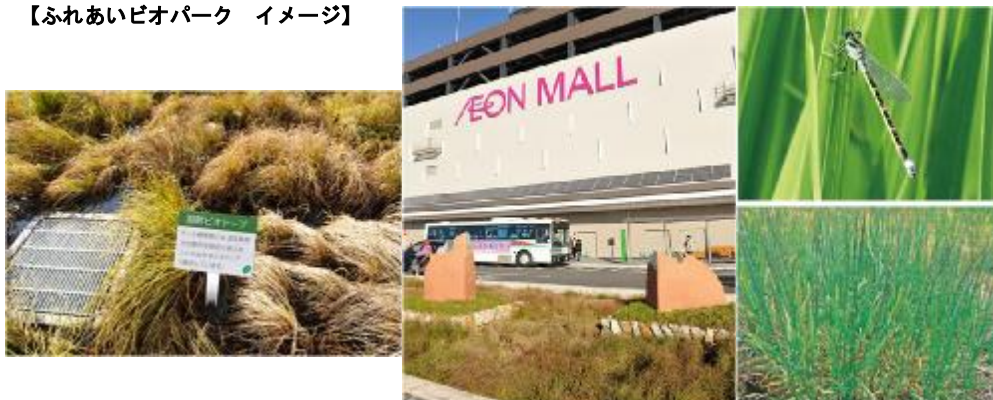
【ふれあいバイオパーク イメージ】

雨水を利用し、生物が住みやすいような環境空間「ふれあいバイオパーク」をガーデン棟の南側に設け、環境学習の触れ合いの場として展開します。大自然を堪能しながらゆっくりとした時間を過ごして頂けるよう、ここでしかできない「体験」「体感」を提供し、地域と密着した施設として機能させていきます。