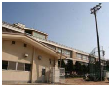
解体予定の奈古小学校舎