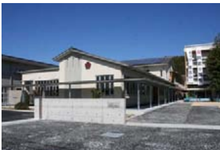
阿武小学校新校舎

この「あぶ」という名称は、古くからこの地を阿武の国・阿牟の国と称され、阿武町の地名の起りりとされています。この阿武の名を校名にして、地域を担う小学校として、一層の発展と充実を期待しています。