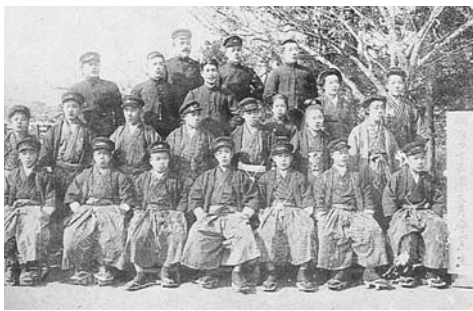
明治43年卒業尋常高小