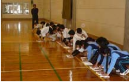
全員で床をぞうきんがけ

卒団式が3月12日(土)に開催されました。9時からバレーやサッカーで親子交流試合を楽しんだあと、一年間お世話になった体育センターを全員で掃除し、それぞれお礼の言葉を交わしました。