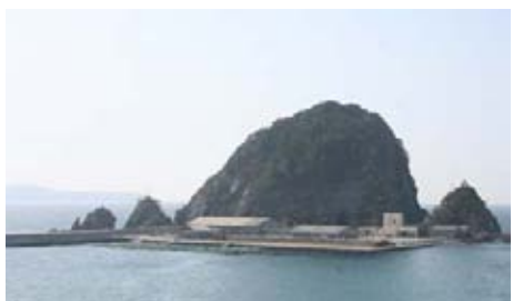
第2外海栽培漁業センター