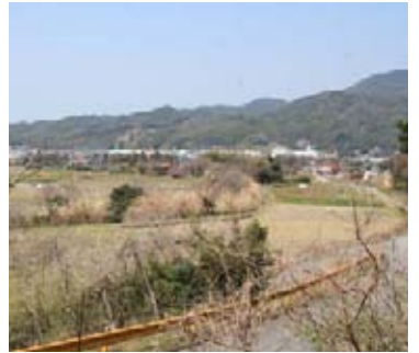
町道柳尾汐入線道路改良事業