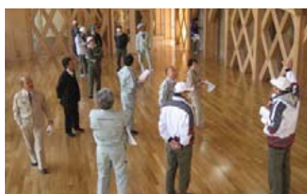
阿武小学校多目的ホール