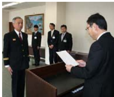
辞令交付式の様子