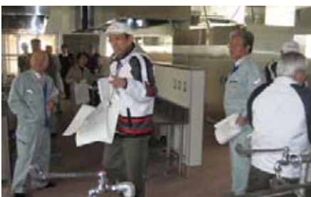
阿武町給食センター