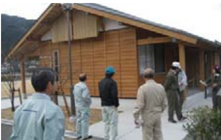
岡田橋集会所の外観