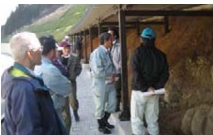
阿武北広域農道イラオ山火山灰層