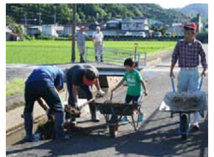
クリーンアップ清掃作業の様子

また、町と自治会の新たな協働のしくみづくりのため、昨年度までに発足した43の自治会に対して、町政の協力