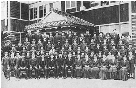
昭和14年卒業尋常科