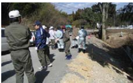
町道岩坪八歩線改良工事