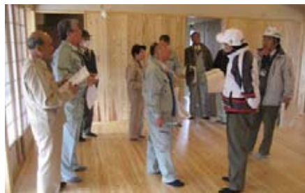
岡田橋集会所の内部