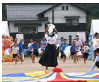
福賀地区運動会の様子

小学校の教育は、 教育長 福賀小学校は、複式教育の歴史が深く、複式ならではの工夫した教育課程を編成し、主体的に学習に取り組む態度を育てています。地域と連携した教育、他校との交流学習等の教育を推進します。