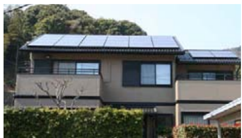
住宅用太陽光発電システム