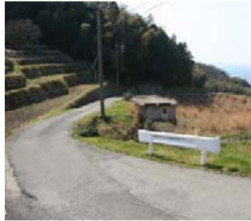
町道長浜西ヶ畑線道路改良事業