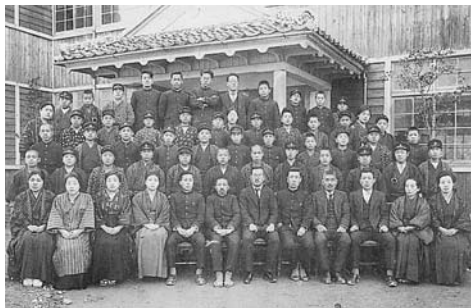
昭和4年卒業高等小学科