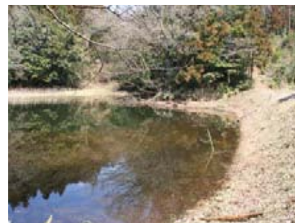
伊豆上地区ため池改修