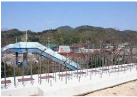
山陰本線を高架する町道汐入野地線

町道汐入野地線道路新設事業に伴う山陰本線奈古駅構内岡田橋高架（仮称）工事を2億9910万8000円で西