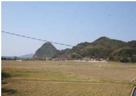
土地区で行う営農飲雑用水測量試験

3月11日に発生した東北地方太平洋沖地震に伴う義援金300万円の支出。「財源は平成22年度予備費を充用」また、人的支援として保健師1人を現地に派遣することを表明。