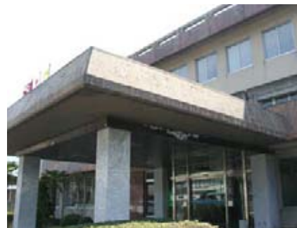
役場本庁庁舎耐震補強改修事業

体で約1ヘクタールの(仮称)阿武町中央公園を整備するほか、平成22年度繰越事業で、老朽化が進み耐震基準を大きく下回っている役場庁舎について、耐震補強を行うとともに、エレベーター、スロープ、