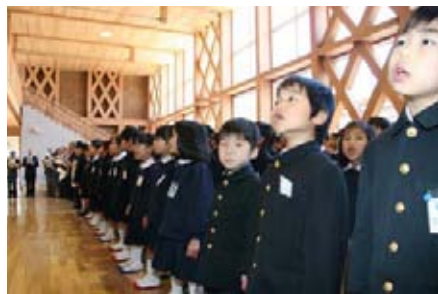
阿武小学校多目的ホールで式典の様子