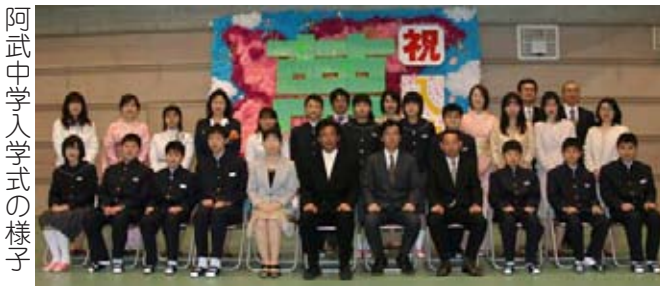
阿武中学入学式の様子

4月8日町内の小中学校で入学式が行われました。阿武小学校では19人、阿武中学校では11人、福賀小学校では3人、福賀中学校では5人が入学し、38人の児童生徒が新たなスタートを切りました。