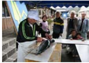
ブリの解体ショー