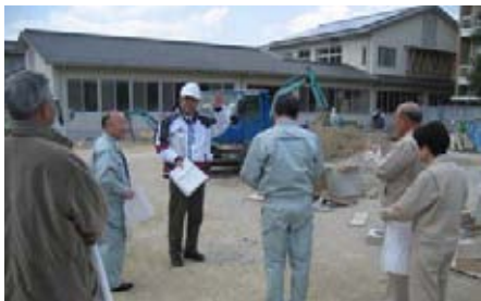
阿武小学校外構工事