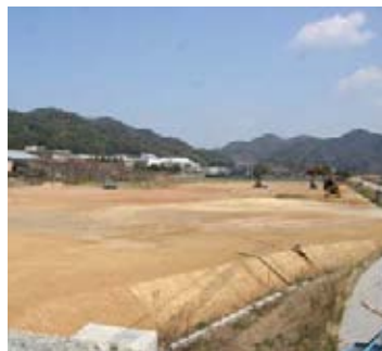
中央公園整備事業