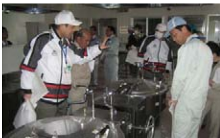
阿武町給食センター