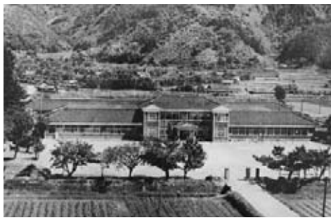
大正時代後期から昭和初期の校舎