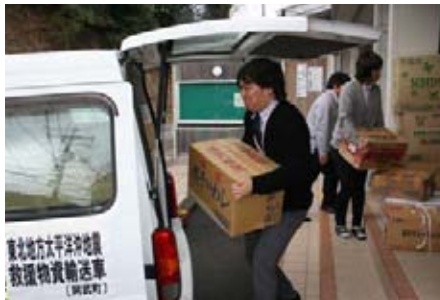
積み込まれる救援物資

3月11日に発生した東日本大震災の被災者への支援及び被災地復興の為に義援金（山口県共同募金会阿武町支会）及び救援物資（阿武町社会福祉協議会）が町内の方々から寄せられました。義援金として総額200万183円（4月8日現在）寄せられたほか、救援物資は軽貨物6台分（段ボール105個）が3月22日と25日の2回にわたって山口県を通じて発送されました。