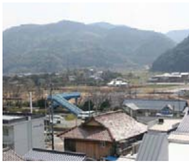
町道汐入野地線新設事業

道路整備関係では、奈古の美里・水ヶ迫周辺からJRを跨ぎ国道に通じる、町道汐入野地線のバイパス新設工事を引き続き実施するほか、県道高佐下阿武線と町道汐入野地線を結ぶ町道柳尾汐入線の道路改良に着手します。また、福賀の町道栃原広乙線下笹尾の広乙橋付近の局部改良を実施するほか、宇田郷の町道長