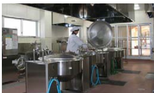
オール電化対応の給食センター