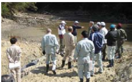
柳尾ため池切開工事