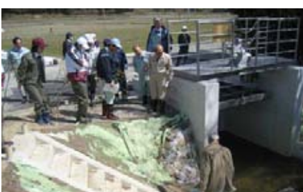
土地区に整備された排水路