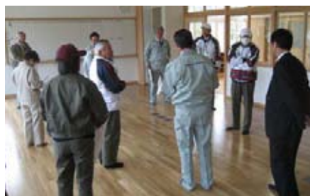
阿武小学校職員室