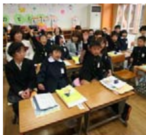
阿武小の学習風景

問 知識基盤社会の時代で子ども達に必要な、確かな学力、豊かな心、健康やかな体の調和を重視する「生きる力」とは。 教育長 子ども達一人ひとりが、自ら個性を發揮