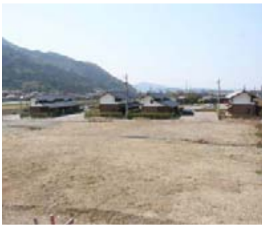
岡田橋公営住宅建設事業

また、今年度新たに町出身者のネットワークの充実を図り、ふるさと愛を基調とするUJイーターンや企業誘致促進の足がかりとするため、同窓