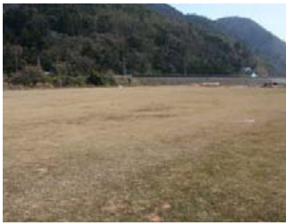
国道開催地の道の駅裏埋め立て地

奈古小学校改築事業、給食センター改築事業の完了に伴う旧奈古小学校校舎、給食センター、バックネットの解体、花壇・植栽の撤去、夜間照明灯、防球ネット、フェンスの設置、駐車場整備等阿武小学校屋外整備事業を実施します。