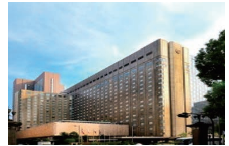
会場となった帝国ホテル