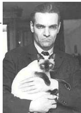
Кнорозов Юрий Валентинович

Морские географические объекты: мыс и остров-скала названы именем Кнорозова Юрия Валентиновича (1922–1999), ученого-лингвиста, расшифровавшего древние письмена майя и активно работавшего на острове Итуруп в 1979-1990 гг. при изучении истории айонов и более древних народов, населявших Курильские острова. Мыс (45°18' С, 147°52' В) и остров (45°18' С, 147°52' В) описаны в ходе Второй экспедиции гидрографического судна по программе «Имянаречение безымянных морских объектов» в ноябре 2012 г. Присвоение имени Юрия Валентиновича Кнорозова мысу и прилегающему острову предложено и обосновано