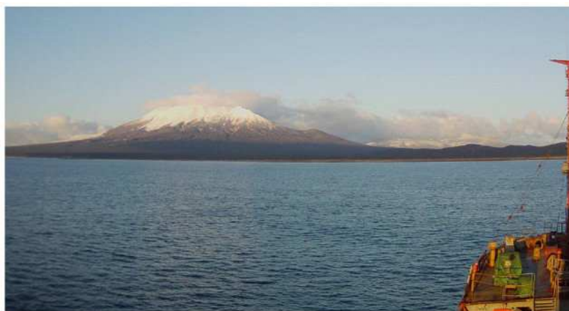
Вулкан Тятя (1819 м) и укрытый дымкой вулкан Докучаева (1486 м) справа.

Утром все население полуострова Ловцова собирается у рыбацкого стана вблизи водопада в северной вершине залива Спокойный Южно-Курильского пролива между островами Кунашир и Шикотан. При встрече ведется дискуссия о существовавшей здесь до 2-й мировой войны узкоколейке; о неотмеченных на карте острова Кунашир озерах и речках; о Сапунгоре на перевале по дороге к маяку; о геополитике и заинтересованности в развитии столь прекрасного края, где пока хозяйничают лишь бесчисленные бурые медведи. Последнее замечание сводится к предупреждению о нежелательности самостоятельных прогулок по острову и его побережью.