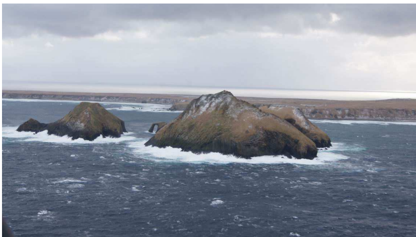
Острова Близнецы. На горизонте – северный берег острова Уруп

Группа островов Близнецы № 1–3 в акватории вблизи северного побережья острова Уруп в проливе Уруп (Буссоль) представлена двумя крупными островами, образованными тремя заметными сопками высотой более 90 м, которые при взгляде с моря ассоциируются с похожими друг на друга горами-близнецами, и небольшой скалой в форме кружки с ручкой.