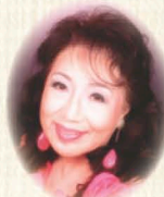
構成・演出・指導 高山 佳子

かたゆきかんこ しみゆきしんこ きくきくくとんとんきくくとん ゆきわたりの晩に、森で出会ったきつねの子と 人間の子どもの心温まる幻想の物語。大切なことは何？