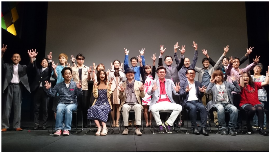
試写会で壇上に登ったスタッフ・出演者たち。

正直、柄がバラバラのパッチワークのようでもあり、種々雑多な具がぎっしり詰め込まれた鍋のようでもある、捉えどころのない映画だ。一言で△△柄とか、○○鍋とまとめにくいのだが、まとめる必要はないのかもしれない。そう、我々はきっと必要以上に線引きをしたがるのだ。高橋和勲（たかはし・かずゆき）監督が「自分自身が何回見ても勉強できる映画」と語ったように、これは一度見ただけで終わりという映画ではない。自分の生き方を見直したり、あるいは仲間や家族と見て自分はこのことが気になったなと話し合ったりできる、いわば見た後が重要な映画なのかもしれない。