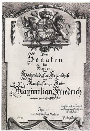
『選帝侯ソナタ』初版譜表紙

有望である。彼はクラヴィーアを練達に力強く弾き、初見の読譜にも優れている。このまま続けていけば、必ずや第二のモーツァルトになることだろう」。師に勧められてはじめて作曲したのも、この頃でした。記念すべきベートーヴェン最初の作品は、クラヴィーア（ピアノ）のために書かれた『ドレスラーの行進曲の主題による九つの変奏曲』でした。翌年には、ケルン選