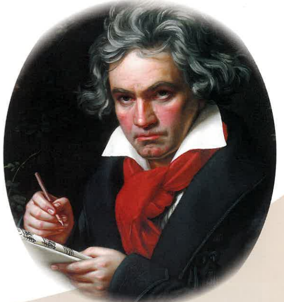
ベートーヴェンの肖像

クラシック音楽の作曲家として世界的にもっともポピュラーな人気を誇るベートーヴェン。二〇二〇年は、楽聖の生誕二五〇年にあたります。それを記念して、今回の「ロゼ・クラシックカフェ・コンサート」では、日本を代表するピアニスト、仲道郁代さんによるベートーヴェン・スペシャルコンサートを予定しています。それにあわせて、今回から二回にわたってお届けするのは、作曲家の伴侶といべきピアノからみたベートーヴェンの物語です。