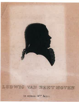
少年時代のベートーヴェン ヨゼフ・ネーゼン作の影絵による石版画

そんなベートーヴェンのもとに、フランスのピアノ製作者エラールから一台のグランド・ピアノが届けられます。五オクターヴ半の音域を持つ、このイギリス式アクションの最新モデルは、ベートーヴェンに新たな靈感をもたらします。ところが、それはベートーヴェンとピアノとの新たな闘いの幕開けでもあったのです。（次号につづく）