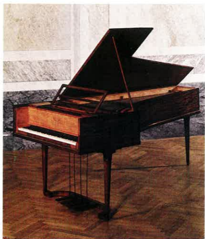
ベートーヴェンのエラール

ベートーヴェンの生涯を通して、ずっとともにあった楽器ピアノ。彼が生きた時代は、この楽器が急激な変化を遂げた