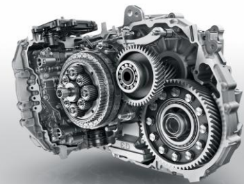
EAT 6 (Efficient Automatic Transmission)

トルクフルな BlueHDi との相性がよく、クイックかつスムーズなシフトチェンジを可能にするアイシンとの共同開発によるオートマチックトランスミッションです。ギヤレシオをガソリンよりもさらにハイギヤード化することで同一速度域でのエンジン回転を下げ、新開発のクラッチによってロックアップ領域を拡大、トルクコンバーターのスリップロスを低減させています。ミッション全体のフリクションロスもさらに低減し、マニュアルトランスミッションとほぼ同等のエネルギー伝達効率を追求することによって、スムーズで省燃費、静粛性を高めています。組み合わせられるストップ&スタートはオルタネーター方式で、クイックで静かな再始動が可能です。