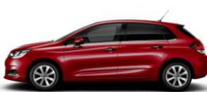
ルージュアルティメット