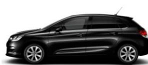
ノールペルラネラ