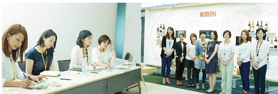
(左 : Bloomoi メンバー、右 : KIRIN グループのオフィスにて、KIRIN グループ女性社員と Bloomoi メンバー)