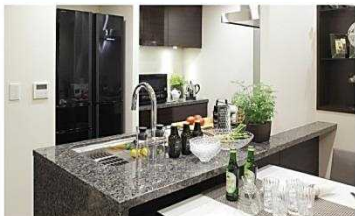
対面カウンターキッチン