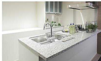
フルフラットカウンター