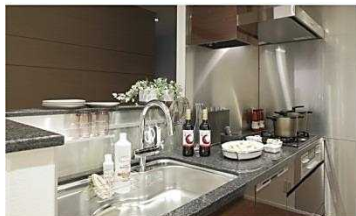
手元が隠れるカウンターキッチン