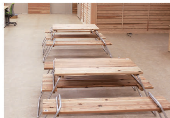
事務所内打ち合せスペース