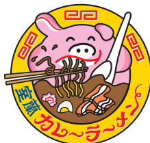
室蘭カレーラーメン