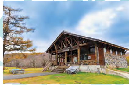
カヤの平高原総合案内所