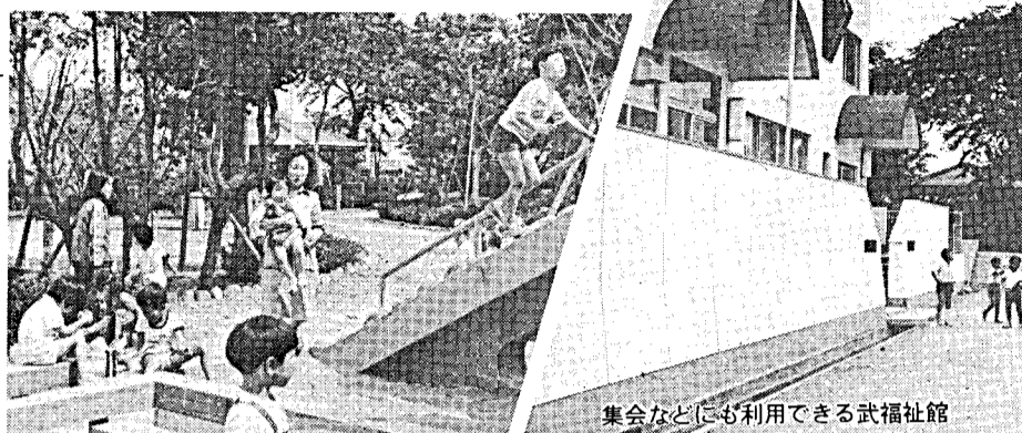
集会などにも利用できる武福祉館