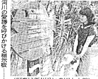
(写真は新川沿いの田上小前)

この結果、所得割を納めなるともよい範囲は、別図(1)のとおりで、所得割を納めていただく方も、別図(2)のように減税されます。計算された税額に不服がある場合は、通知を受けた日から六十日以内に異議の申立てをすることがあります。また天災その他特別な事情によって納税が困難となった場合には、納期限前七日までに減免の申請もできます。その他市県民税について疑問の点がありましたら、市役所市民税課又は各支所の税務課(係)へお申し出ください。