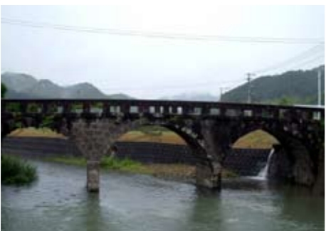
アクセス 富高八幡神社より西へ徒歩3分 文・写真 教育総務課文化財係 (☎内線2415)

られている長崎市内には、17世紀ごろから架けられてきた石橋が現在も41か所残っています。年間降雨量が多い九州地方では、昔から洪水による橋の流失に悩まされてきました。そのためにも、頑丈な石橋をつくる必要があったのでしょう。市内には、明治時代より前に石橋がつくられたという記録はありません。長崎の石橋に比べると、「昭和橋」はそれほど古いものではありませんが、私たちの先輩たちが地域の発展に努力していたことを示す貴重な文化遺産であることには間違いありません。