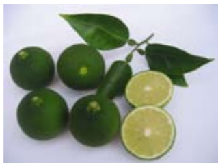
1パック 300円 ●道の駅ひゅうが (☎56・3800)

が旬の日向特産「へべす」は、種が少なく皮が薄いため、果汁を絞りやすくなっているのが特徴。さわやかで上品な香りとはほどよい酸味はいろいろな料理に合い素材の味を引き立ててくれます。ぜひ、この時期にお料理などにどうぞ。