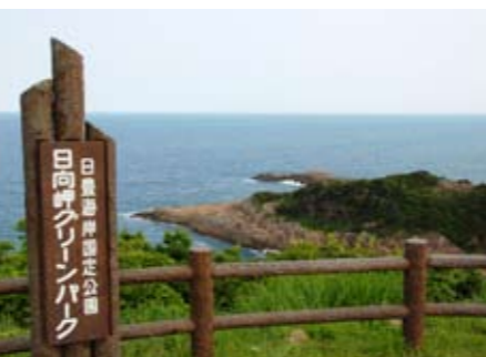
公園区域の確認など、不明な点は問い合わせください。 ●環境整備課環境政策係 ☎53・2256