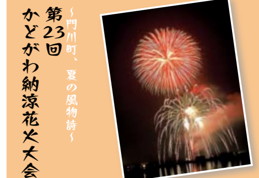
第23回 門川町、夏の風物詩 かがわ納涼花火大会

今年で23回目を迎えるかどがわ納涼花火大会。日向灘を舞台に、約4,000発の打ち上げ花火や仕掛け花火が次々に打ち上げられます。真夏の夜空を彩る魅力と迫力満点の大輪の花を満喫してください。 かどがわ納涼花火大会は、毎年皆さんからの協賛金に支えられ開かれています。今年もご支援をよろしく願います。 ●日時 8月30日(出) ※雨天順延 午後8時から打ち上げ開始 ●場所 門川漁港 ※駐車スペースに限りがありますので、公共交通機関を利用してください。なお当日は交通規制があります。 ●問い合わせ 門川町役場 産業振興課商工係 ☎63・1140(内線291)