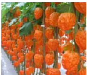
観賞用ホオズキ ●ふるさと市場 (☎68・3070)

郷町域では、ホオズキを3戸の農家が栽培、ふるさと市場などで販売しています。いまは、観賞用としてドライフラワーなどに用いられるホオズキ。むかしは、子どもたちが果実を口に含み、音を鳴らしたりして遊んでいました。