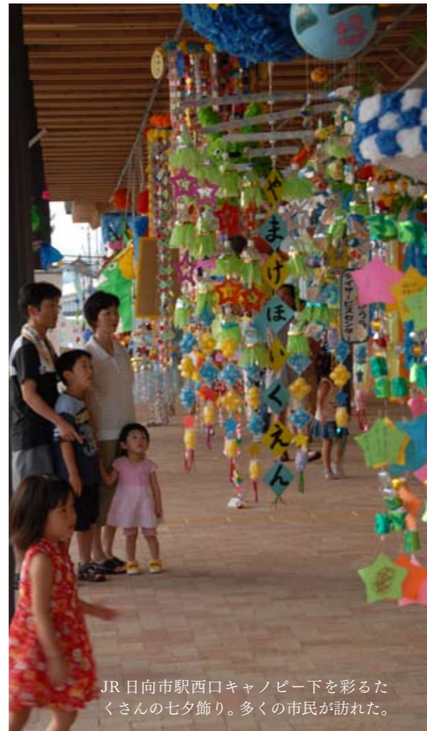
JR日向市駅西口キャノピー下を彩るたくさんの七夕飾り。多くの市民が訪れた。

上町商店街十街区パティオを中心に、7月5日開かれた第4回七夕祭り。土曜夜市も開かれていたこともあって歩行者天国となった道沿いの会場は、たくさんの市民でにぎわいました。会場には子どもたちが楽しめる手作りのゲームコーナーなども設けられ、星への願いごとを短冊に書くコーナーには、たくさん子どもたちが列を作りました。 また、今年3月に完成したJR日向市駅西口キャノピー下は、大がかりな43もの七夕飾りで彩られました。市内の保育園や社会福祉施設などの利用者が制作したもので、約10日間飾り付けられ、たくさん市民の目を楽しませました。