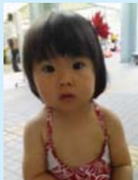
青山海兎ちゃん 2さい(日知屋) じいちゃん ばあちゃん。いつもありがとう。2歳になったよ!