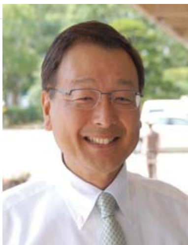
●富島高校同窓会の問い合わせは、事務局(富島高校事務局) ☎52・2158

9月20日に、ホテルベルフォート日向で「富島高校」同窓会を開きます。同級生やなつかしいクラブのメンバーなどとミニ同窓会で集まって、みんなで参加というのも楽しいのではないのでしょうか。富島高校「やまび鼓」の太鼓披露や「スピリッツ」のコンサートもありますよ。