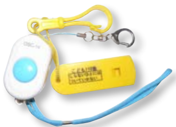
※防犯ブザーやホイッスル(笛)の効果は絶大です。子どもがいざというときに防犯ブザーなどを活用できるように、日ごろから点検し、使い方を教えてあげましょう。

また、発生場所の多くは人通りが少ない道路や公園などの屋外です。また、被害の特徴や子どもたちへの声かけの窓口には次のようなものがあります。 ・「いっしょにゲームをしよう」「好きなものを買ってあげるから」「困っているから助けて」などと言葉たくみに話しかけてどこかへ連れ去る。 ・車の窓ごしに声をかけ、近づいた瞬間にドアを開けて車内に引っ張り込む。 ・人通りの少ない路地や死角に連れて行かれ、暴行や恐喝を受ける。 ・公園の樹木の陰やトイレなどに連れ込まれる。 子どもたちが被害にあう可能性が高いのはどのような状況で、どんな場所なのか？ 気をつけなければならぬことは？