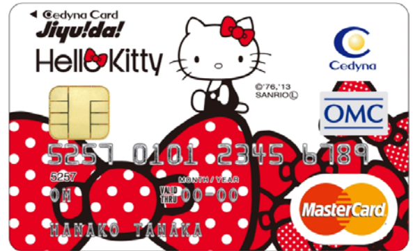
【セディナカードJiyu!da! ハローキティ】