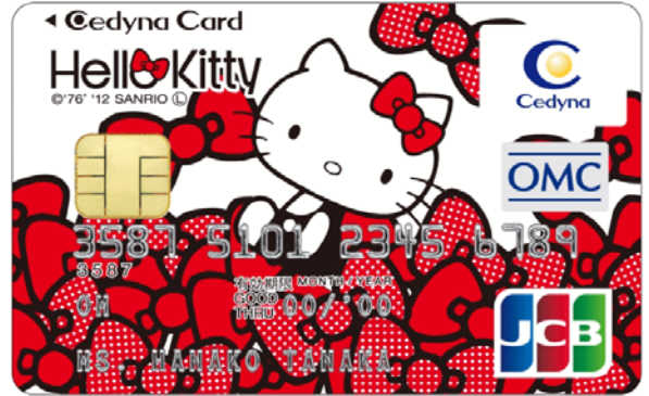
【セディナカードクラシック ハローキティ】