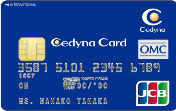
【セディナカードファースト】