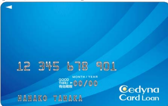
【セディナカードローン】