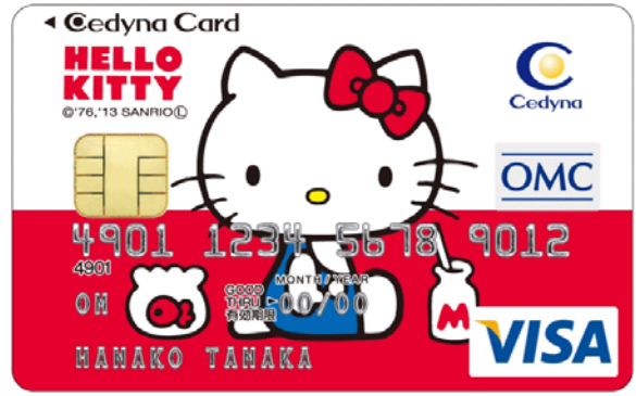
【セディナカードファースト ハローキティ】