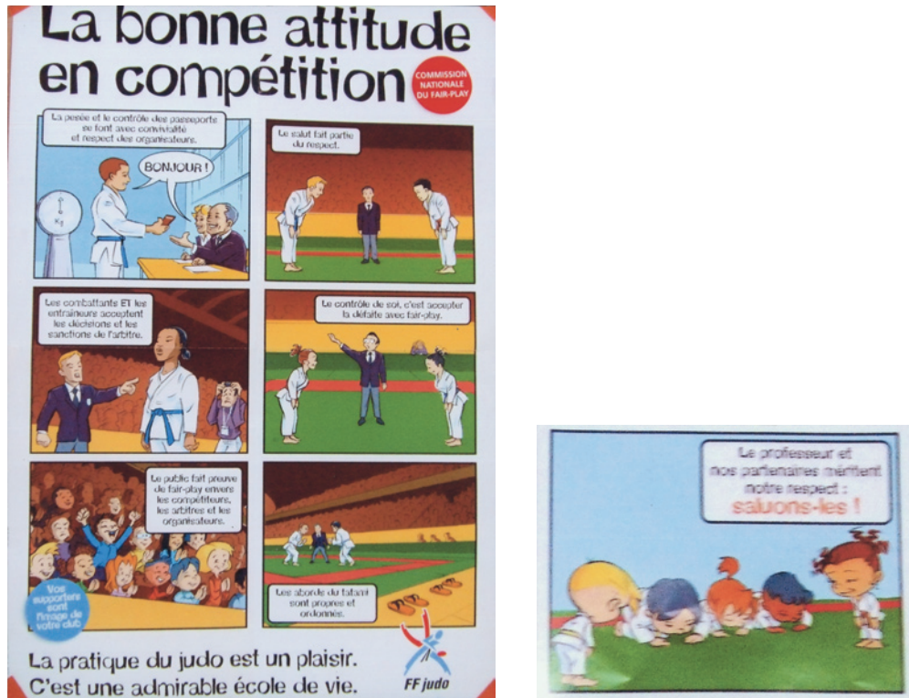
図1. FFJDA 礼法（青少年向け）ポスター

フランス柔道の発展の要因の一つには、時代の流れを正確に掌握し、それに対応する柔軟な思考、臨機応変な対策を迅速に構築し実行したことが考えられる。グローバル化が加速し、留まることを知らないかのように変動していく柔道界にあって、我々創始国日本人の果たす役割はまだまだ重要である。世界のリーダーとしての役割や働きを果たすことは、国際貢献にも寄与するものである。日本柔道の発展的方向性を探るためにフランス柔道を研究することは、柔道に関わる指導者にとって意義あるものと捉えている。