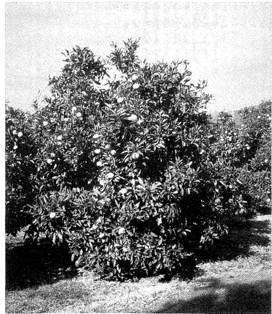
図 1. 「清見」の樹体

イルスフリー植物の育成には有用な特性であるが, 多胚性品種を種子親に用いた場合に雑種獲得率が低く, 交雑育種の大きな障害となる。多胚性の遺伝については, 多胚性が単胚性に対して優性に遺伝し, 単胚性は劣性ホモで発現することが明らかにされている (Parleviet and Cameron 1959, Iwamasa et al. 1967)。育種親として望ましいウンシュウミカン, スイートオレンジ, ポンカン等の優良品種の多くは多胚性である。多胚性の程度は平均胚数が 2 内外のものからポンカンのように 50 近くのものまであり, 品種により異なっている。「宮川早生」と「トロビタ」オレンジはともに平均胚数が 20 前後ある高度の多胚性である (上野ら 1967)。「宮川早生」に「トロビタ」オレンジを交配した組合せにおける雑種獲得状況を表 5 に示した (西浦・岩崎 1964)。育成実生数に対する雑種獲得率は 4.5% で大部分は珠心胚実生であった。その結果, 獲得した雑種は 3 個体のみで, 「清見」はその中から選抜された。「宮川早生」に「トロビタ」オレンジ以外の品種を交配した組合せにおいても, 雑種はほとんど獲得できなかった。早生温州と普通温州を合わせたウンシュウミカンの品種にスイートオレンジ類を交配した組合せからは, 全体で 24 個体の雑種が獲得され, 「清見」のほかに「興津 12 号」(「薬師寺温州」×「トロビタ」オレ