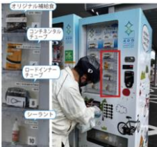
休憩施設の機能向上 (自転車関連グッズ自動販売機の設置)