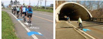
路面表示(矢羽根)による安全対策