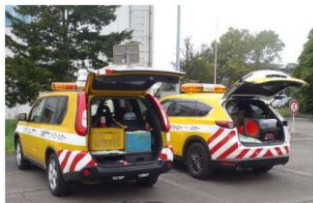
緊急サポート体制 (道路パトロールカーに工具搭載)