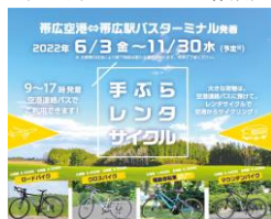
移動サポート体制 (手ぶらレンタサイクル)