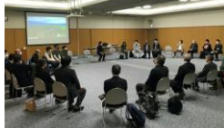
地元ガイドの育成 (サイクルガイド事業者交流会)