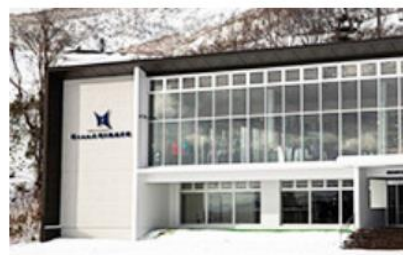
マウンテンセンター アネックス開業 (2019年)