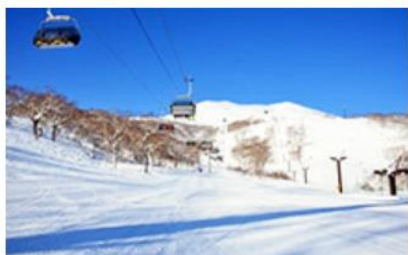
キング第3リフトリニューアル (2016年)