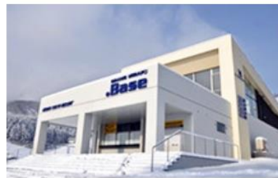
.Base (ドットベース) 新設 (2012年)