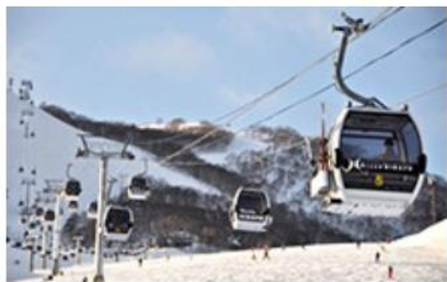
ヒラフゴンドラリニューアル (2011年)