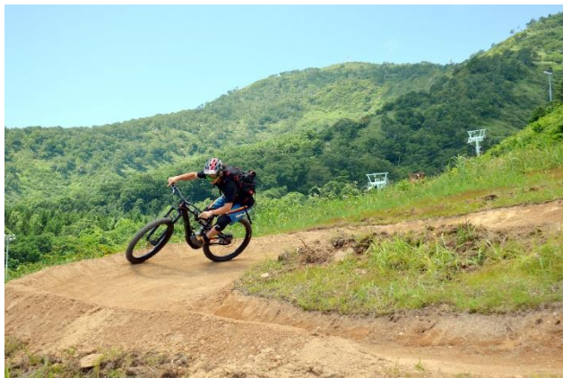
フロートレイルコース