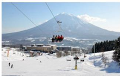
エースファミリーリフト リニューアル (2017年)