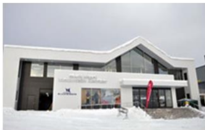
マウンテンセンター新設 (2011年)