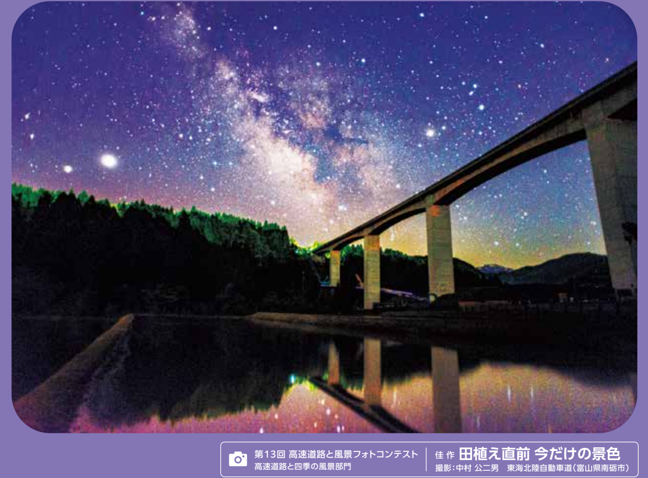
第13回 高速道路と風景フォトコンテスト 佳作 田植直道 今だけの景色 東海北陸自動車道(飯山南南側)