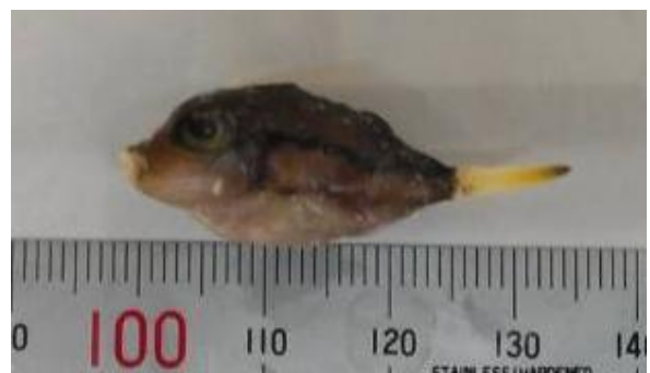
図2 豆アジに混入したフグの幼魚

尾鰭と皮より抽出したDNAテンプレートをを用い、ミトコンドリアDNAの16S rRNA、 cyt b および cyt c の3種の遺伝子部分領域の増幅を行い、塩基配列の解析を行った。解析した塩基配列の相同性の検索結果を表2に示す。16S rRNA 遺伝子部分領域については Canthigaster rivulata (キタマクラ)および Canthigaster rostrata (カリビアンシャープノーズパファー)と全く同じ塩基配列を示し、この結果のみではフグ種の特定には至らなかった。一方、 cyt b および cyt c 遺伝子部分領