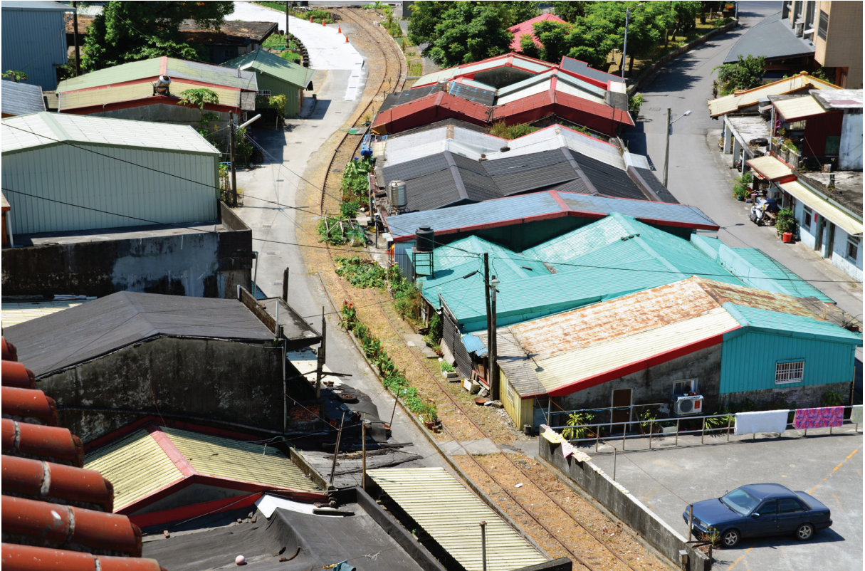
【圖 9-1-5】俯拍臺泥蘇澳廠舊鐵道

臺泥蘇澳廠線全長共有 1.3 公里，自蘇澳車站起約在 358 公尺處，設有轉轍工房乃臺泥線與永春線轉轍點，另於 460 公尺處，設有一座臂木式號誌機，至今依然存在。另由蘇澳車站往前行駛之鐵道，則為蘇澳港線，途經白米溪路段，今日保有水泥橋鐵道一座。昔時，蘇港線沿途需經過蘇東隧道，今日仍可見其遺址與部分鐵道存在。較具觀光特色是，臺泥線進入永春線之轉轍站，除了保有號誌閘柄與轉轍器等器具外，在永春線上，經過白米社區守望相助隊附近之直線鐵道，與永春路平行之路段，已經地方居民重新整理，逐漸形成地方特色景點，即使永春路建設時鐵道已有不少破壞，但永春線與周遭居民的生活融合，形成一股新的文化特色。