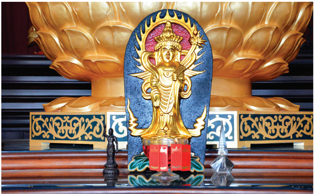
【圖 9-1-14】南光寺石佛