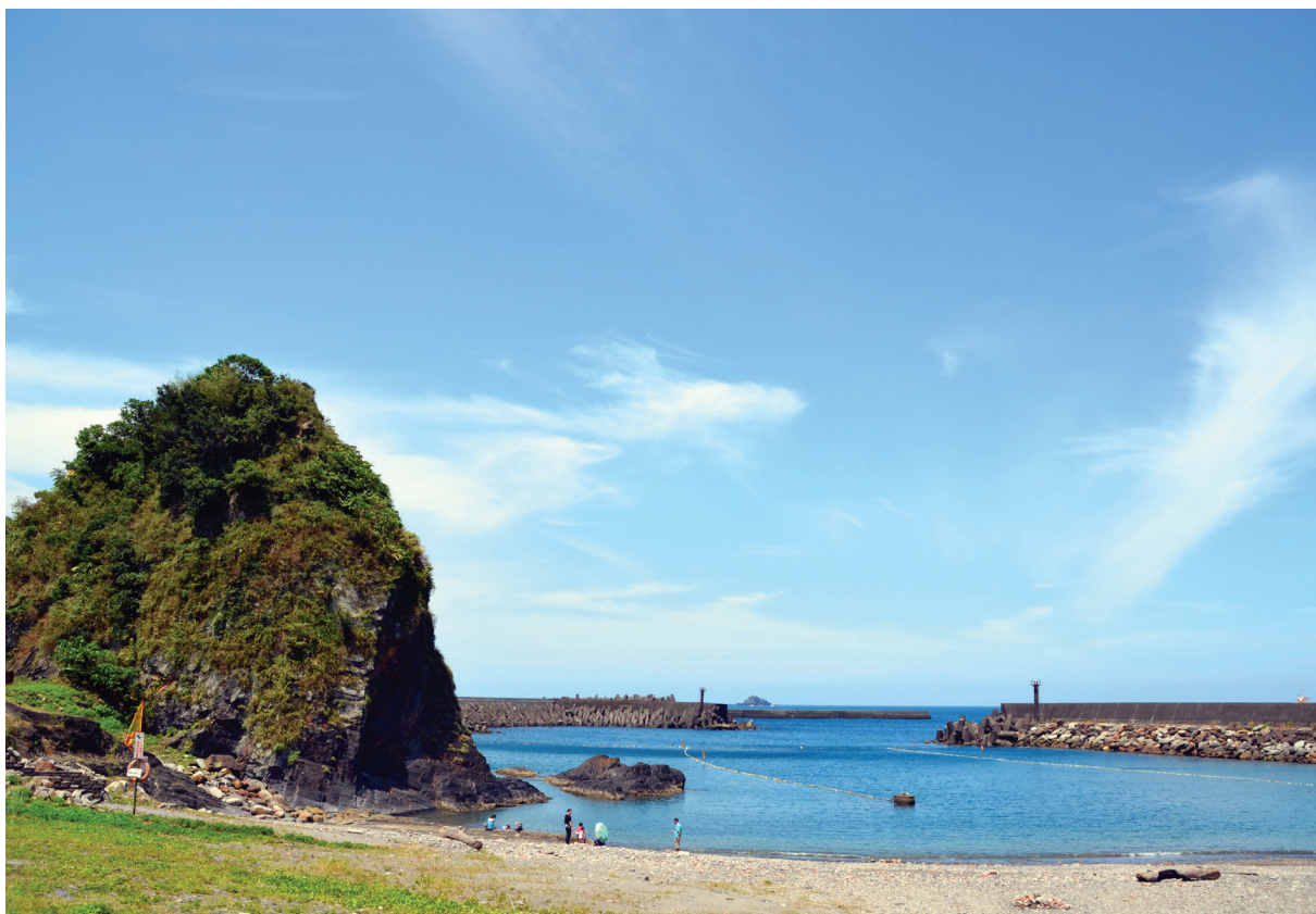
【圖 9-1-9】豆腐岬景觀

豆腐岬原本規劃為漁港專用航道, 但在蘇澳商港南側防波堤竣工後, 使得豆腐岬的地形成為一處半封閉的弧形, 凹槽底部的海灘成為附近居民嬉水弄潮的好去處。