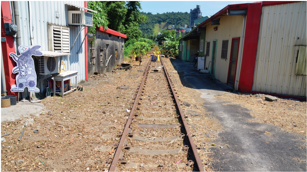
【圖 9-1-4】臺泥蘇澳廠舊鐵道

1962年（民國51年）波蜜拉颱風襲臺，蘇澳車站受損，其後站房改建為鋼筋混凝土構造，並為候車室與廁所進行擴建。1966年（民國55年）1月1日升等為一等站。