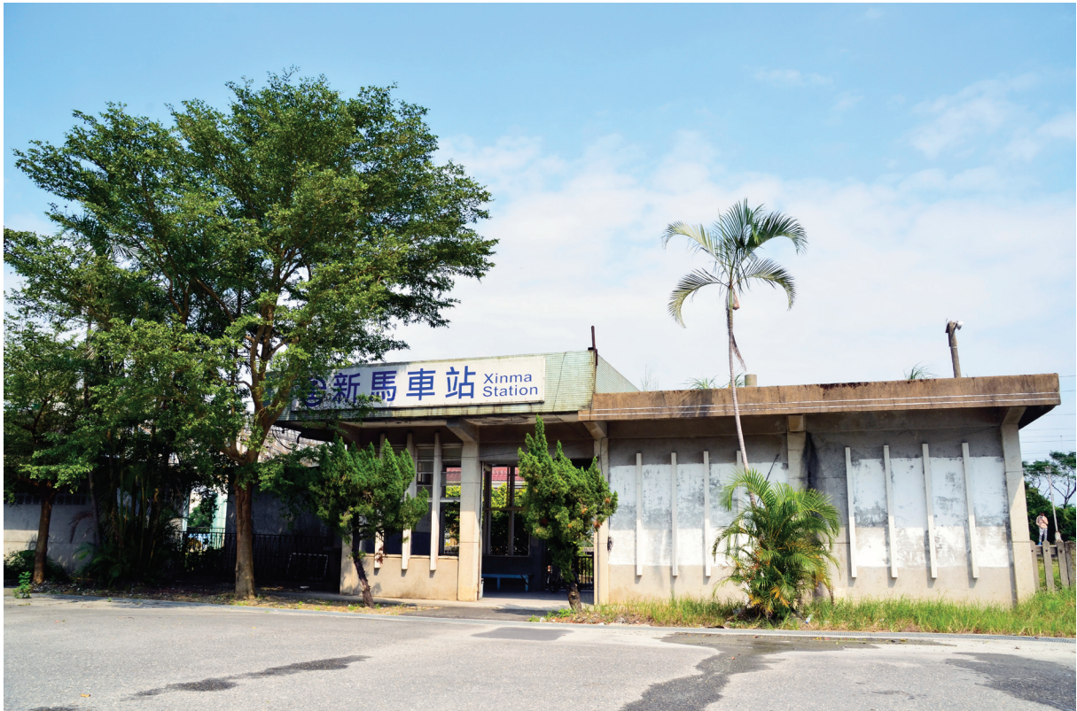
【圖 9-1-6】新馬火車站

22日正式啟用，時稱為新城驛。1975年（民國64年）6月1日，考量北迴線上花蓮新城站與該站同名，遂改稱聖湖站，1983年（民國72年）改稱新馬站迄今。