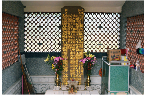
【圖 9-1-10】羅大春開闢道路紀念碑

朝廷威福也，將用命也，不可不紀，囑幕次三衢范應祥撰文，三山應道本書丹，龍眠方宗亮、齊安高士俊選石，勒諸大南澳道左，黔中馮安國監造。 24