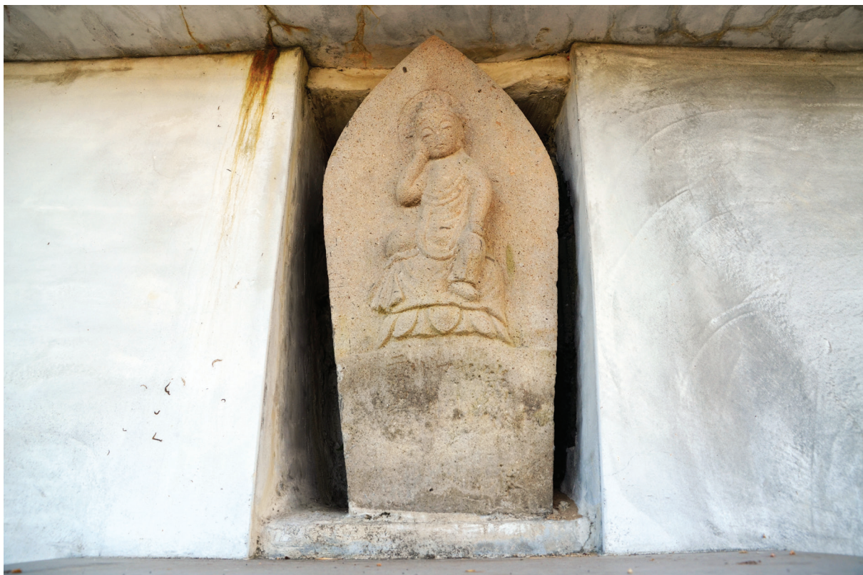
【圖 9-1-15】祥光寺石佛

祥光寺石佛非屬宜蘭新西國石佛系統，佛像為右手托腮，凝視面前蓮花的思惟相，根據其造相，可推斷其應為觀音 33 法相之 9 的「施藥觀音」，另外，雕像下緣勉強可看出刻有文字，疑似有「昭和」二字，但其實該石佛形塑之詳細年代難考。