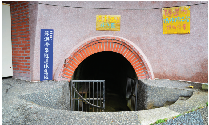
【圖 9-1-2】蘇澳冷泉隧道

蘇澳冷泉隧道正確興建年代不詳，據耆老所言，今日蘇澳冷泉池附近一帶之土地，在昔日多是荒煙蔓草，杳無人跡。由當地耆老回憶所得，可能於日治時代末期即已鑿成。由於該隧道通往海邊，故有防空洞、軍防通道與疏洪道等三種說法。