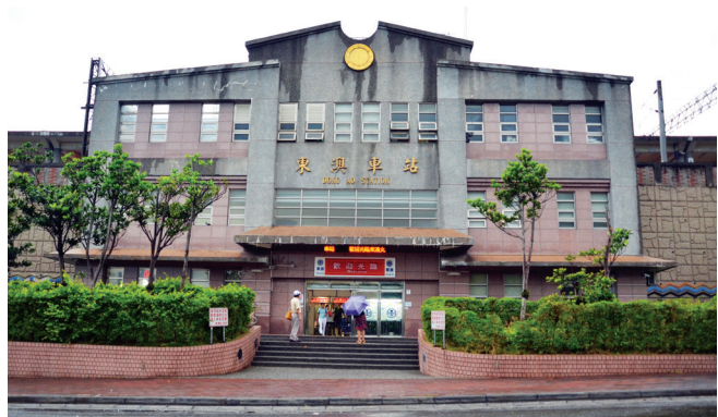
【圖 9-1-8】東澳火車站

東澳火車站非屬蘇澳鎮，位於南澳鄉東岳村東岳路 60 號，距蘇澳新站起點 10 公里 700 公尺。該站於 1978 年（民國 67 年）啟建，北迴線通車時正式營運，原屬花蓮管理處管轄，1982 年（民國 71 年）2 月 16 日才改由宜蘭運務處管轄。1985 年（民國 74 年）7 月 1 日由三等站調整為二等站，隔年 12 月電氣路牌閉塞式切換為 A B S 自動閉塞行車制。