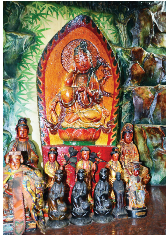
【圖 9-1-13】第一番キイ青岸渡寺如意輪觀世音

南光寺供奉的石佛原被安奉在寺後的山壁，正對南方澳港灣，庇佑鄉里，1981年（民國70年）南光寺建寺後，石佛才被移奉自寺內，1990年（民國79年）南光寺在能度法師的領導下進行整建，新建寺宇期間，石佛險遭宵小偷竊，以致面部鼻樑毀壞，1992年（民國81年）南光寺新建工程竣工，石佛也重妝貼金祀奉於該寺頂樓的大雄寶殿。 34