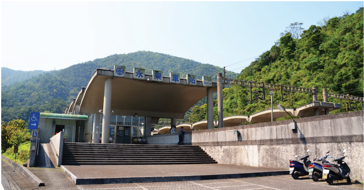
【圖 9-1-7】永樂火車站

後，為配合臺灣水泥公司蘇澳廠供應水泥原料之需求，辦理貨運業務而設站。迄至 1987 年（民國 76 年）9 月，才開始兼辦客運業務，以方便當地協助開採礦石之居民乘車，屬於三等車站。