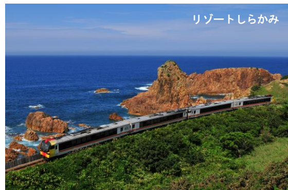
リゾートしらかみ

https://www.jreast.co.jp/railway/joyful/shirakami.html