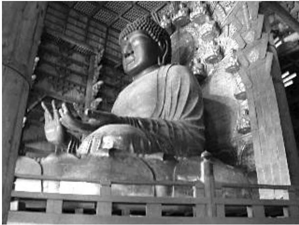
737 藤原氏4兄弟 天然痘で死去 741 国分寺 743 大仏造立の詔勅 752 大仏開眼