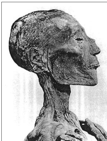
Ramses V 1157 BC