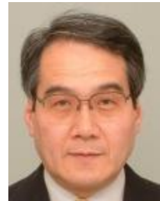
山本昭男 宇宙航空研究開発機構 執行役