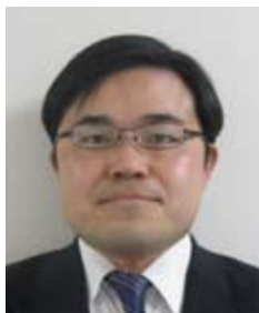
岡井敬一 宇宙航空研究開発機構 総合技術研究本部