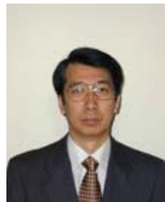
柳 良二 宇宙航空研究開発機構 総合技術研究本部