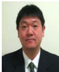
田頭 剛 宇宙航空研究開発機構 総合技術研究本部