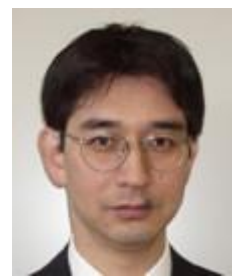
岩掘豊 宇宙航空研究開発機構 総合技術研究本部