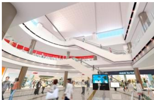
【増床棟内イメージ】

・1Fでは、グローバルファッションの人気ブランドが一堂に介するほか、感度の高いインテリア&ファッション雑貨を多様なスタイルで集積したゾーンを中心に構成。2Fは、家電&ホビー、キッズ&アミューズメント、スポーツ、ライフスタイル雑貨&食物販の4つのゾーンで構成。お客さまのニーズと、熊本唯一、熊本最大にこだわった専門店の店揃えです。