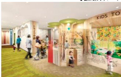
【増床棟内イメージ】

・2Fには、ご家族でお子さまと楽しみながら休憩できる、新しいレストスペース「トモイクの森」を設けました。地場産材を使用した温もりを感じられるリフレッシュ空間です。当モールではコミュニティ機能のさらなる充実にむけて既存棟にお子さまの遊び場「トモイクひろば」を設けるなど、様々な取り組みを行っています。