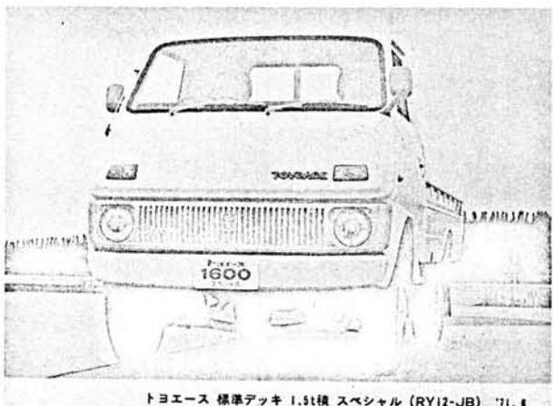
トヨエース 標準デッキ 1.5t積 スペシャル (RY12-JB) '71.4