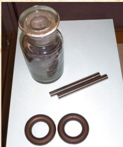
写真2: センダスト粉末（奥）、センダスト棒コア（中間）、通信用部品センダストコア（手前）（金研資料展示室（株）トーキン寄贈）