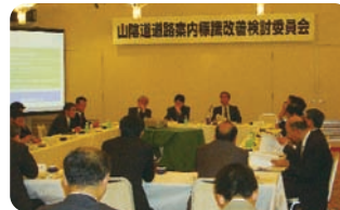
委員会での議論の様子