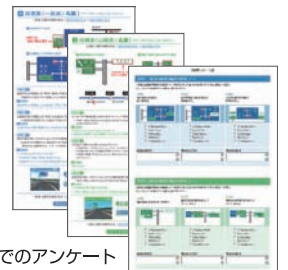
Web上でのアンケート