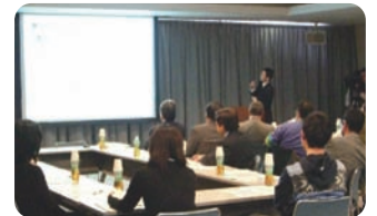
一般モニターによる評価会の様子