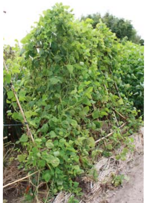
苗は3m以上も成長し、生き茂るように葉が付き、莢は中下部当たりから付き始める