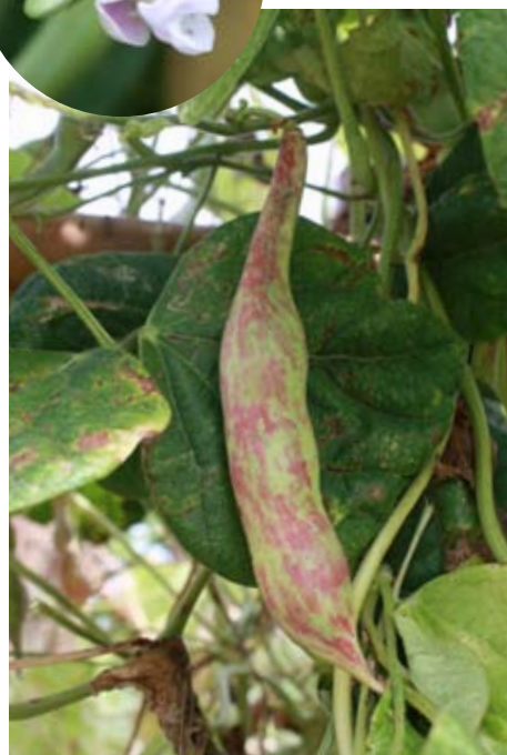
若莢の収穫期を過ぎると、莢にも種子のような茶褐色や赤紫色の斑紋が入る