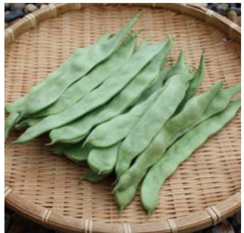
白いんげんの若莢の頃。中の種子はまだ淡い緑色で、次第に膨らみながら白色へと変わる

親孝行豆も白いんげんも、種子の収穫時期は11月下旬です。茶色に枯れた莢を摘み取り、ザルやゴザ等に広げて十分に乾燥させた後、莢より豆を取り出し収穫します。収穫した豆は、ガラス瓶に入れ冷暗所で保存します。種子用は、できるだけ新しい豆を使用し、食用として10数年ほどは保存可能です。