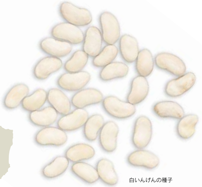
白いんげんの種子