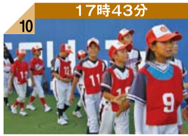
17時43分 10 緊張気味に入場するスポーツ少年団の子供達。