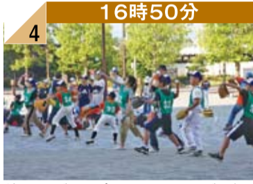
16時50分 4 練習は、グループに分け、タイミングを合わせて「エイっ」。