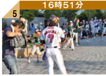
16時51分 5 練習で指示を出すますくまん、それを追いかけるTVカメラ。