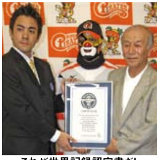
これが世界記録認定書だ!

「ギネス世界記録™はひとえにファンや地域の皆様のご協力で成し遂げることができました。本当にありがとうございます。この記録に負けないよう、今後とも皆様に感動して頂ける試合をお見せしたいと思います。県民球団として改めて頑張ります」