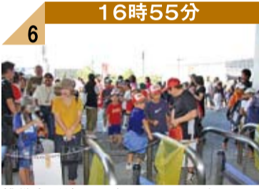
16時55分 6 挑戦者が練習に励んでいた頃、球場入口には開場を待ちわびるファンの皆さんが列を作っていました。