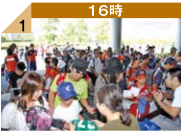
16時 1 さあ、受付開始です。定刻の16時前には既に120人余りがエントリーのために列を作っていました。