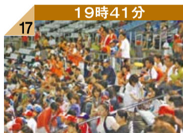
19時41分 17 ギネス世界記録™達成に盛り上がるスタンド。この日は今季最多の2858人の観客に会場頂きました。