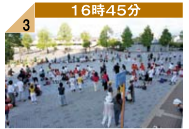
16時45分 3 球場の正面広場で挑戦者の皆さんが始球式の練習を行っていました。100組以上となると練習だけでもこの迫力です。