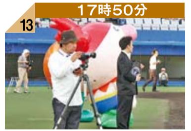
17時50分 13 始球式の模様は、設置した5台のビデオカメラで撮影され記録されました。