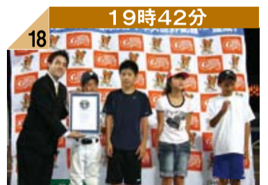
19時42分 18 表彰式には、始球式に参加してくれた福島の子供達も参列、スタンドから激励の拍手が送られました。