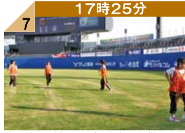
17時25分 7 本番直前、外野では始球式の準備に大わらわ。女子高生のボランティアが大活躍してくれました。