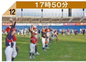
17時50分 12 バシッ!捕手は捕球した直後「ボールを取りました」と高々とアピールします。