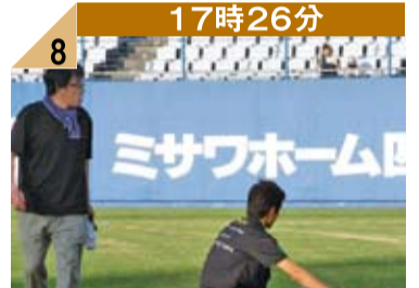
17時26分 8 「58、59、60・・・」最後まで慎重にチェックを繰り返すスタッフ。