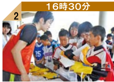
16時30分 2 エントリーの列は途切れません。ゼッケンを貰い、皆グローブを片手にやる気満々。