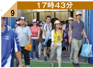
17時43分 9 いよいよグラウンドに入場です。参加者は118組、236人、地元TV局の人気アナも沢山参加してくれました。