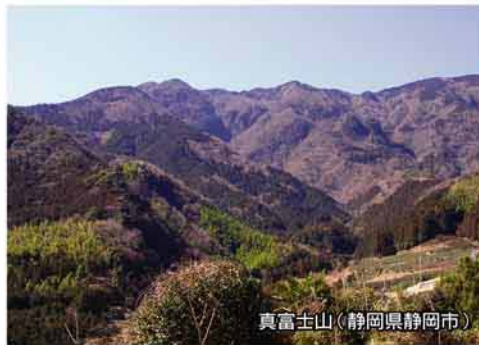
真富士山(静岡県静岡市)

全国で富士と呼ばれる山は、そのすべてが富士山にそっくりというわけではありません。「蝦夷富士」と呼ばれる北海道の「羊蹄山(ようていざん)」など、その姿が富士山そっくりな山もありますが、「孤立していて雄大な感じがする」「全体としては似ていないが、一定の方向から見る姿が似ていたり、頂上の形や裾のひき具合など、一部分が似ている」「姿はま