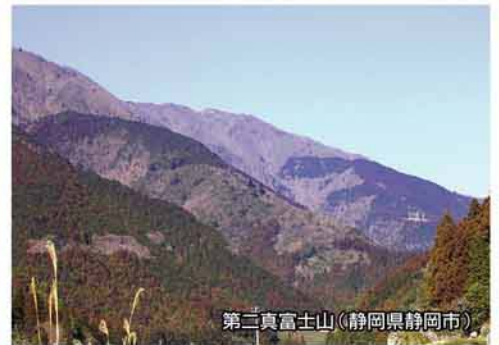
第二真富士山(静岡県静岡市)

ったく似ていないが、地元で象徴的な山」を富士と呼ぶようになり、それが定着したケースなどがあるようです。