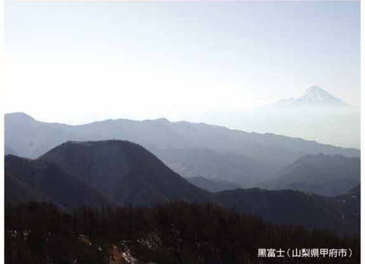
黒富士(山梨県甲府市)