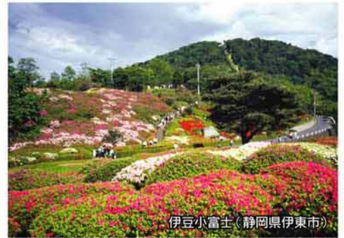
伊豆小富士(静岡県伊東市)