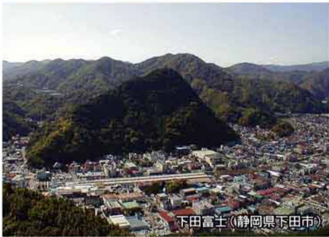
下田富士(静岡県下田市)