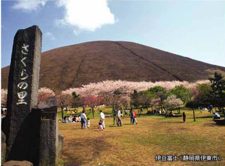
伊豆富士(静岡県伊東市)