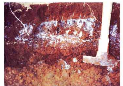
写真1: 凍土層の断面