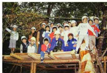
▲ジュニアフォレストースクールにて、ツリーハウスに集合!

は大変良いことなのですが、山林に平気でゴミを捨てていく人がたくさんいます。それどころか、トラックいっぱい廃棄物を捨てて行く心ない者もいます。山林は私有地ですが、昆虫を捕えたり山菜や薬草を自家用に採る位なら大目に見ております。しかし山菜や薬草を採るために木々を傷つけたり、地面に穴をあけたままにしたり生態系に影響が出るくらい根こそぎ採って行ってしまったりする人も少なくありません。これは自然に対する慈愛の念が希薄になっているからではないかと思えます。そういった意識やマナーを育てて行くためにはまず、自然に直接ふれ、親しんでもらうことが大切と考えました。普段あまり自然と触れあう機会の少ない子供達に、親御さんとともに自然を体験してもらおうことを目的としています。」