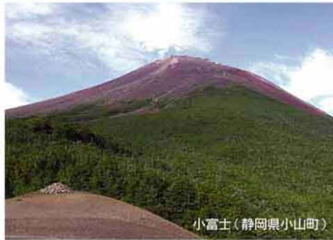
小富士(静岡県小山町)