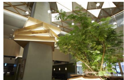
<8F Food Hall>