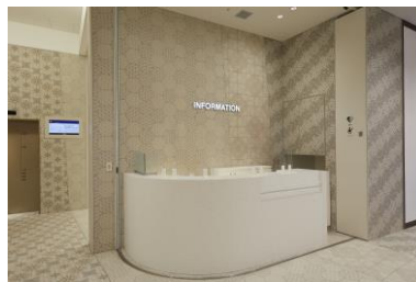
<1F インフォメーション>