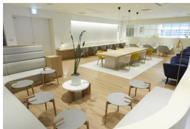
<7F NEWoMan LOUNGE>