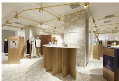
<5F NEWoMan Lab.>