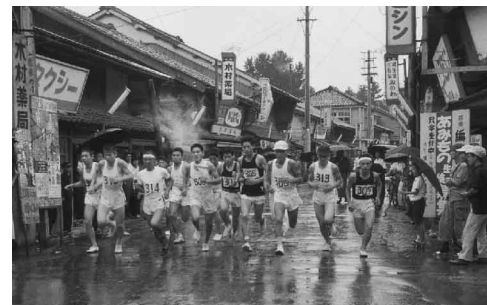
9/23 市民マラソン大会(10km)を開催し、選手17人が参加。