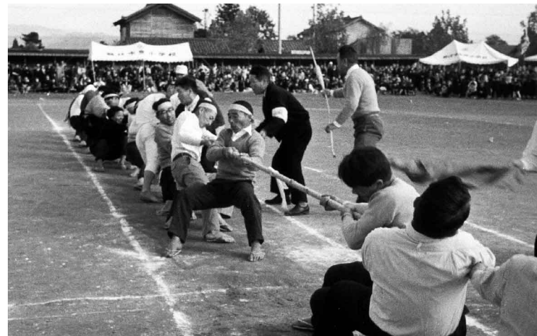
11/3 市民体育大会での綱引き競技。足下はわらし、陸上競技は裸足だった。