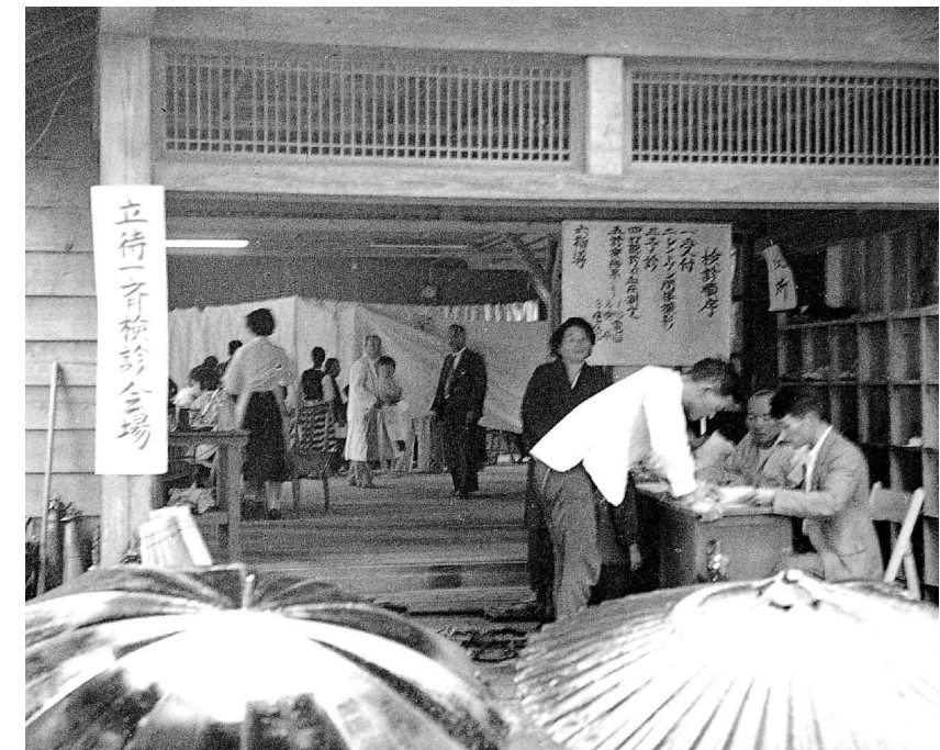
健康診断での受付風景。