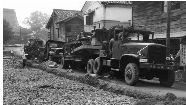
現国道417号の舗装工事(場所は現桜町1、3丁目で、後方に本山誠照寺が見える)。