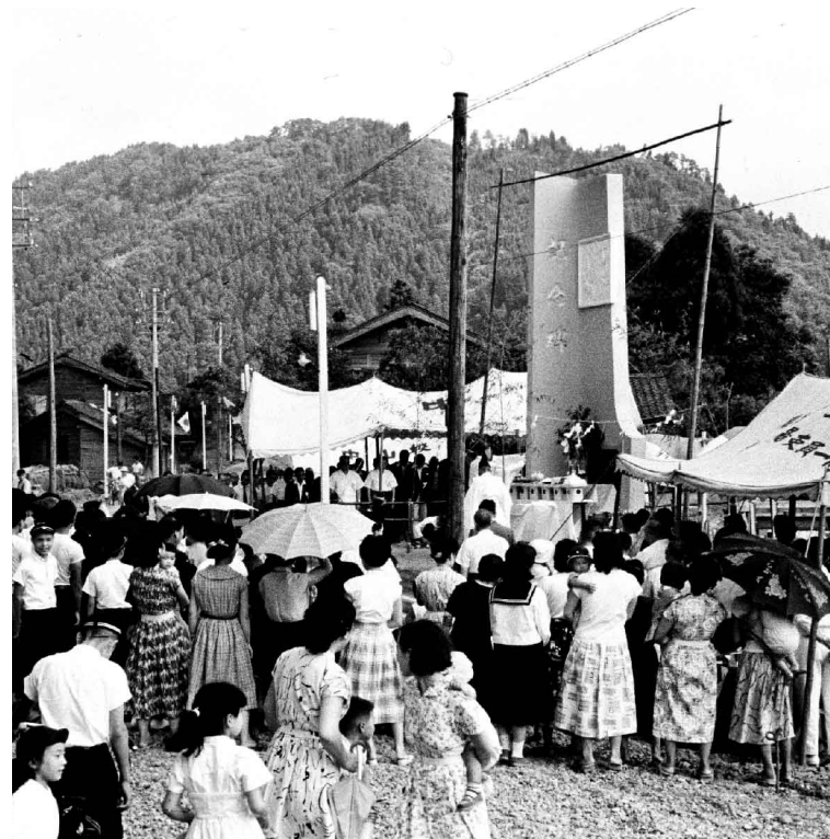
7/14 昭和21年から着工していた河和田川改修工事(全長6,500m)が完成、記念碑は戸口町。