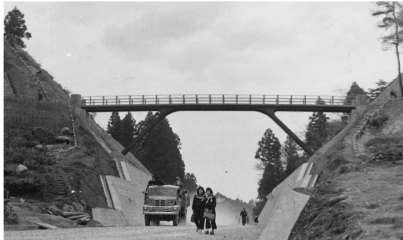
4/11 旧踏雲峡西山橋が完成。