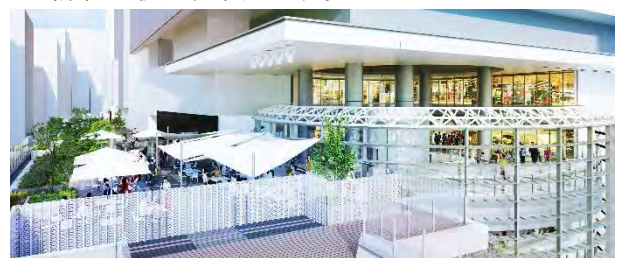
4階ヒカリエデッキ 渋谷駅方面から昼のイメージ