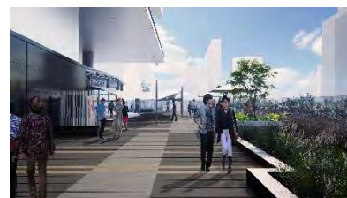
4階ヒカリエデッキのイメージ