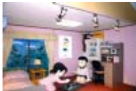
しずかちゃんの部屋