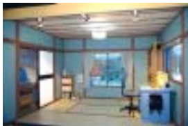
実物大！のび太の部屋

「実物大！のび太の部屋」は、実寸大で再現！実際にのび太くんになった気分！？ 「ドラえもん誕生物語」では、ドラえもんの誕生のひみつがわかります。