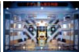
ドラえもん誕生物語