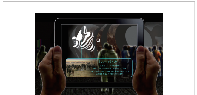
AR端末を使った館内周遊ツアー(2013年秋導入予定) Orbi内では、AR端末を貸し出し、館内周遊ツアーを実施します。各エンタテインメントエキシビションでAR端末をかざすと、野生動物などの詳しい情報を見ることができます。