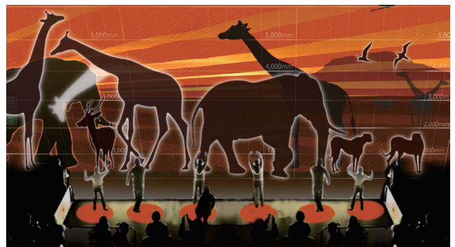
等身大で表示された動物とコミュニケーションをすることで生態を楽しく学ぶことができる「動物等身大百科」。カメラ認識センサーを用いて画面に非接触で楽しむことが可能です。