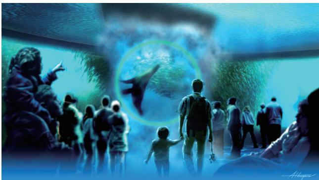
浅瀬から深海までを巡る海中遊泳の旅を楽しめる、海をテーマにした癒しと神秘の空間。フォグスクリーンを用いた立体的演出が特徴です。