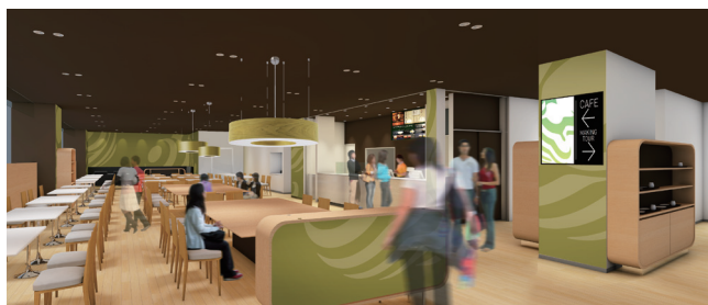
館内全貌を見渡せるカフェ。