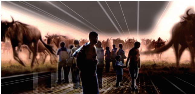
BBC EARTHのヌーの大群映像と、振動装置、立体音響装置、衝撃波装置などにより、130万頭のヌーの群れの真っ只中にあるような体験を経験できます。

130万頭のヌーの群れの真っ只中にあるような体験や、BBC EARTHの豊富な空撮映像を活用した地球一周4万キロに及ぶ美しい地球上空の飛行体験、体感温度-20℃の極寒体験、等身大で表示された動物とコミュニケーションをすることで生態を楽しく学ぶ「動物等身大百科」など、様々な感覚を刺激するコンテンツで他にはない新しい体験を提供します。地球や生命の持つ神秘を、アトラクション的・ゲーム的手法を通じて体で感じ体験し、より楽しく、より分かりやすく、理解し学ぶことができます。