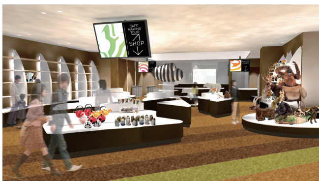
オリジナルグッズを揃えたショップ。