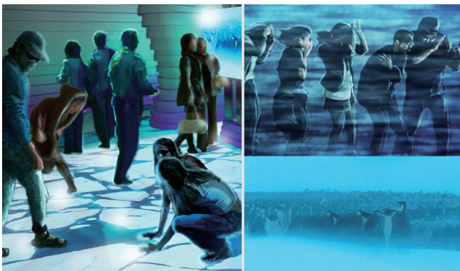
体感温度-20℃の世界を体験。室温を下げた特殊な部屋の中で、突風を起こす送風機とプロジェクターによる映像演出を使って吹雪を再現します。