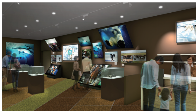
BBC EARTH の撮影チームの舞台裏を紹介するメイキングコーナー。

最後に体験する「Post-SHOW (ポストショー)」エリアでは、「Orbi」内での体験を振り返り、その余韻に浸ることができます。館内各所に設置したカメラで「Orbi」体験中のお客様を撮影、ポストショーエリアにてその日の体験を振り返り、思い出となる写真を提供します。また、BBC EARTH の撮影チームの舞台裏を紹介するメイキングコーナーも設置しています。その他、館内全貌を見渡せるカフェや様々なオリジナルグッズを揃えたショップも設けています。