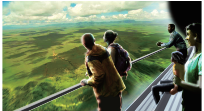
BBC EARTHの豊富な空撮映像を活用した、美しい地球上空の飛行体験。さわやかな風を浴びながら、地球一周4万キロの飛行体験を経験できます。