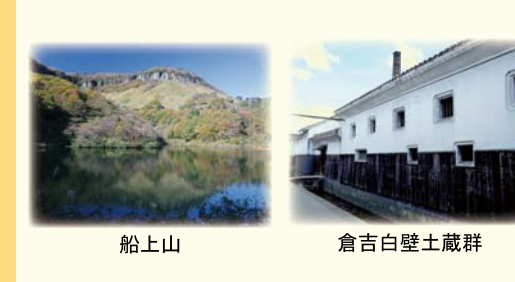
船上山 倉吉白壁土蔵群