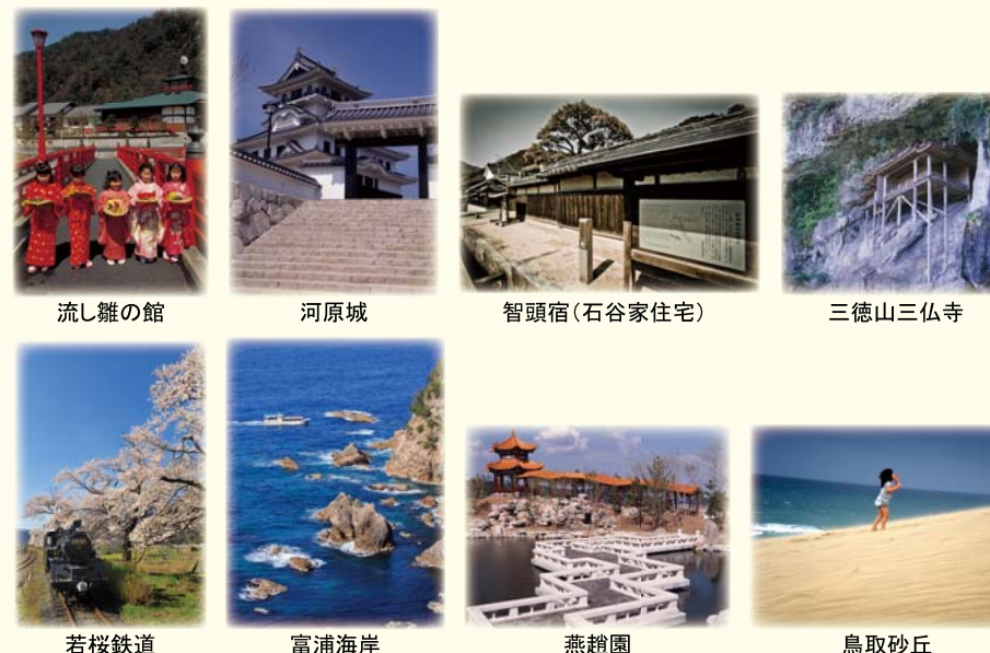
流し雛の館 河原城 智頭宿(石谷家住宅) 三徳山三仏寺 若桜鉄道 富浦海岸 燕趙園 鳥取砂丘