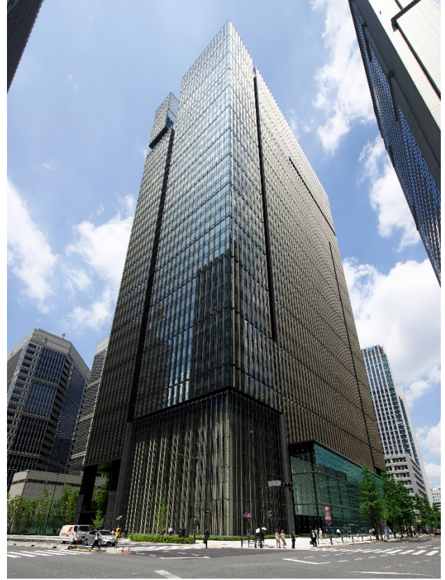
【大手町タワー 外観】