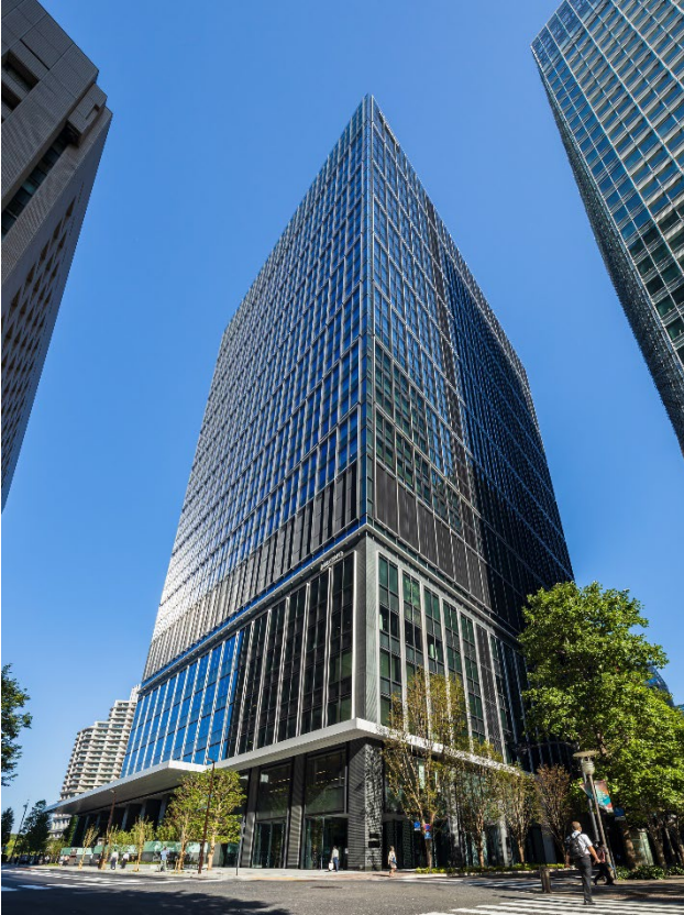
【みずほ丸の内タワー 外観】