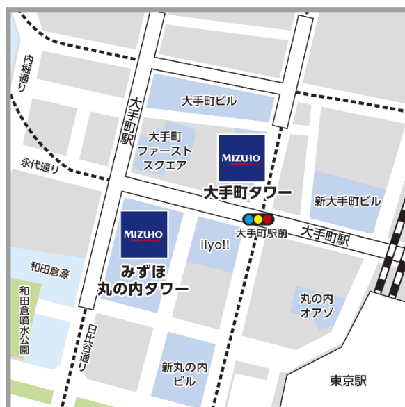
【みずほ丸の内タワー・大手町タワー 地図】