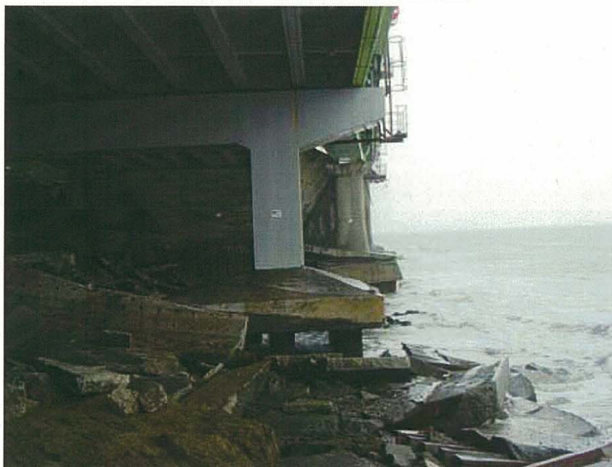
被災直後状況写真(金波橋の下から大磯方面) 平成19年9月撮影