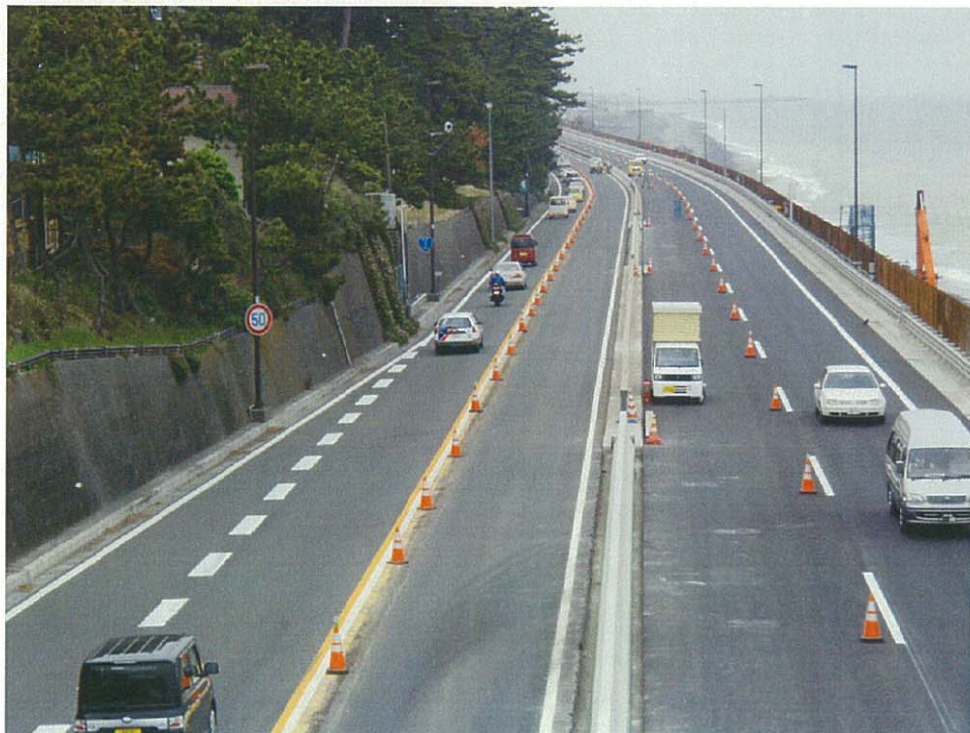
暫定4車線供用前状況写真(西湘二宮ICから大磯西IC方面) 平成20年4月16日撮影