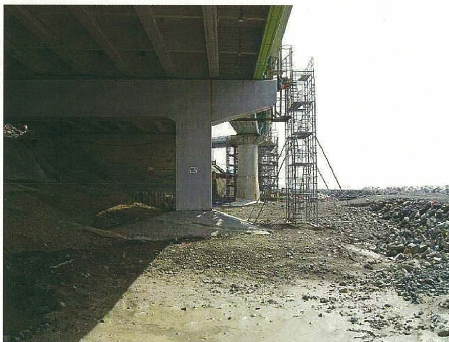
暫定4車線供用前状況写真(金波橋の下から大磯方面) 平成20年4月15日撮影