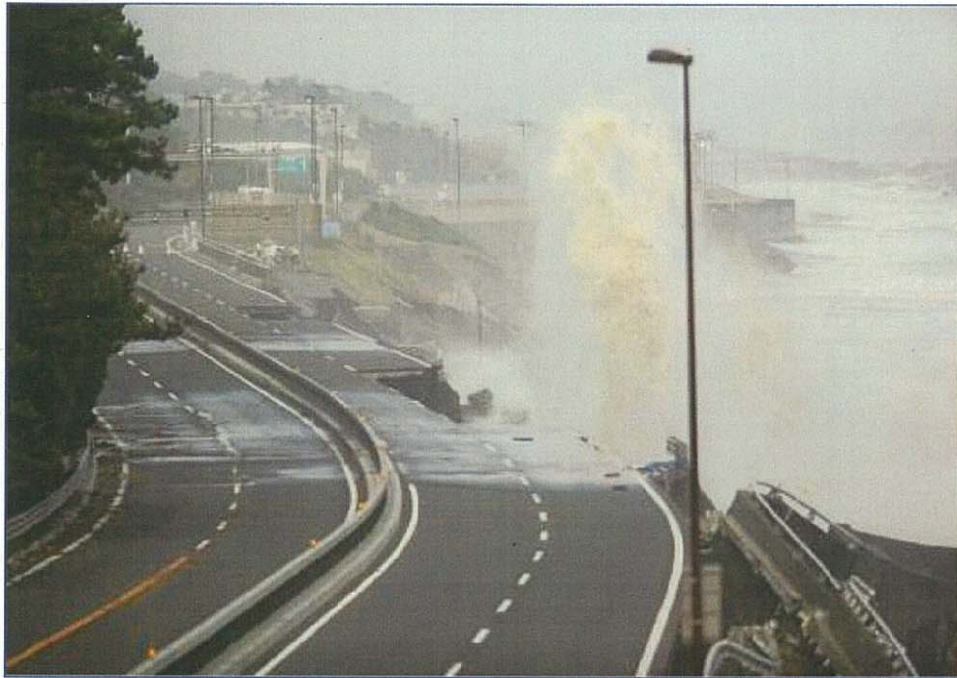
波浪被災状況写真(西湘二宮ICから大磯西IC方面) 平成19年9月7日撮影