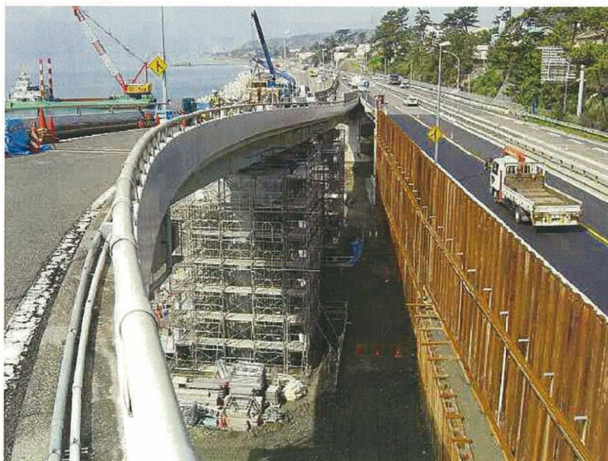
暫定4車線供用前状況写真(西湘二宮ICから橋IC方面) 平成20年4月15日撮影