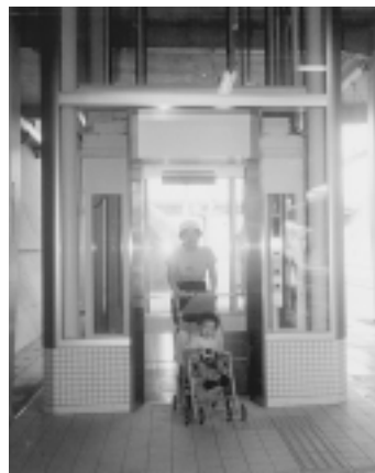
市内全駅のバリアフリー化を目指します

市では障害のある方や高齢者、小さなお子さんの方などの要望に応え、昨年度の交通バリアフリー法の制定も受けて、鉄道事業者と協力して急ピッチで駅のバリアフリー化に取り組んでいます。7月23日に東急田園都市線つくし野駅内にエレベーターが完成し、運行を開始しました。 この事業は駅のバリアフリー化を進めるために、町田市、東京都国が工事費の一部を負担する制度を利用して、東急電鉄が工事を施工したものです。市内では昭和56年にJR町田駅に設置されて以来、東急田園都市線南町田駅・すずかけ台駅・小田急線町田駅に次ぎ5駅目となります。今年度は、小田急鶴川駅・JR相原駅、京王相模原線多摩境駅でもエレベーター設置等のバリアフリー化工事を着手予定です。また、小田急玉川線の実現に向けて鉄道事業者と協議を進めています。 町田市民病院 写真の展示コーナー ができました