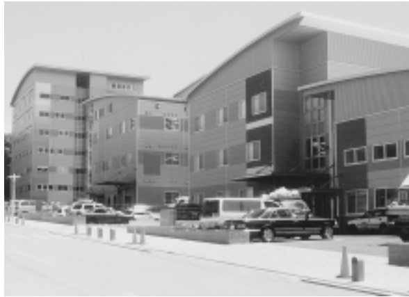
整備が進む企業団地