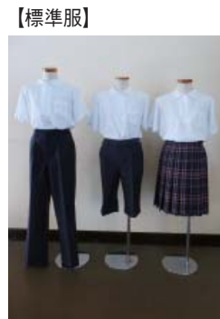
1 2 3 4 5 6 7 8 9 私 服 標準服 制服