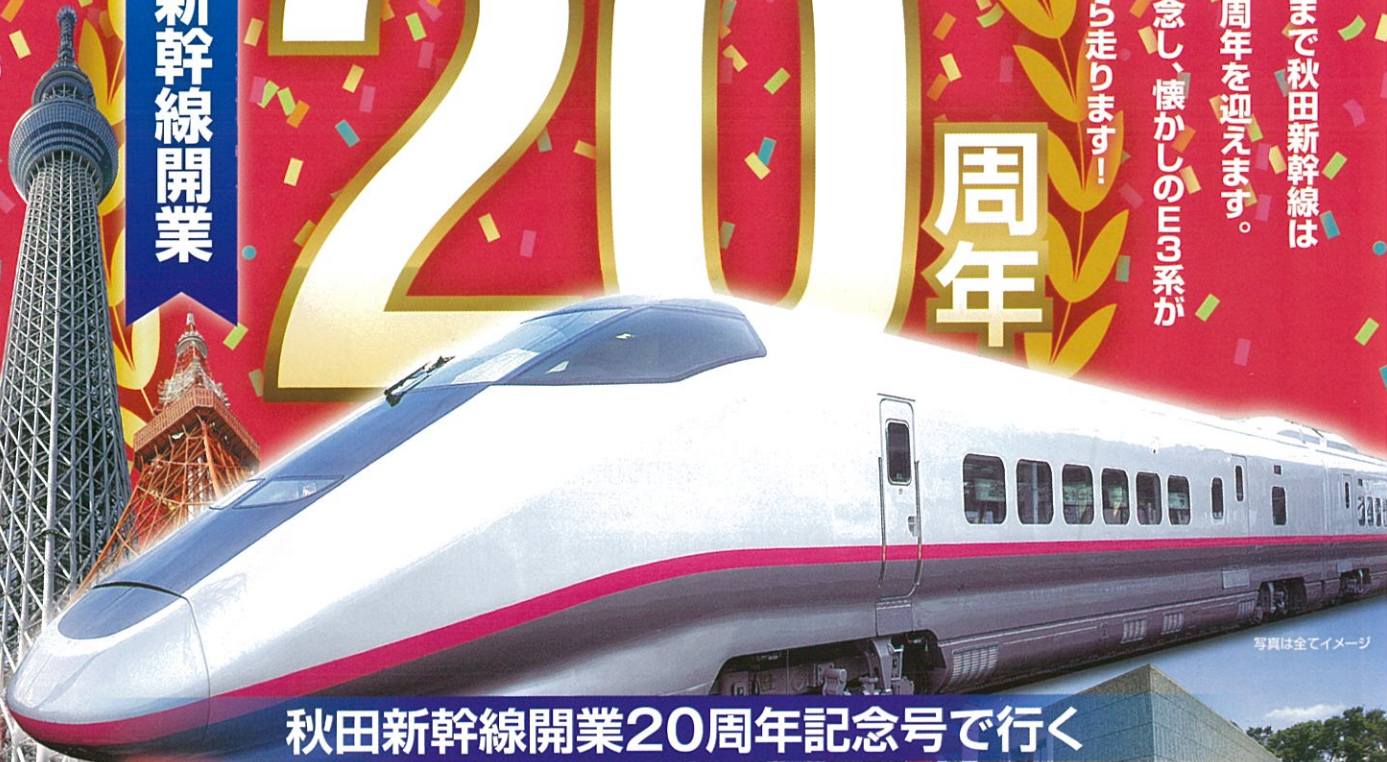
写真は全てイメージ

おかげさまで秋田新幹線は開業20周年を迎えます。それを記念し、懐かしのE3系が秋田駅から走ります!