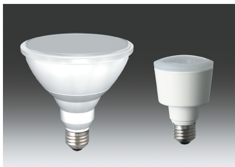
図1 LED 電球

LED 電球は、電球と同じ口金を持ち白熱電球の代替えとして省エネ、長寿命が期待される。