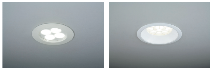
図2 LED 器具

LED 電球は、電球と同じ口金を持ち白熱電球の代替えとして省エネ、長寿命が期待される。