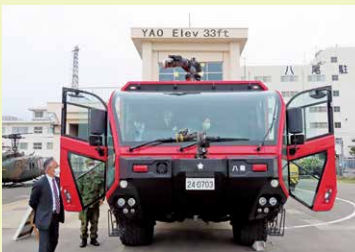
展示装備品の説明