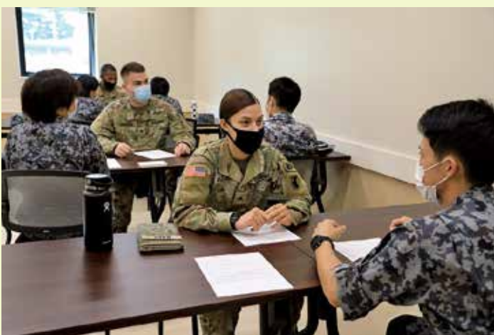
英会話交流の様子

ここ、京都府北部には航空自衛隊経ヶ岬分屯基地の他に、海上自衛隊舞鶴地方隊、陸上自衛隊福知山駐屯地と米陸軍経ヶ岬通信所が存在しており、それぞれ強固な責任感を持って任務にあたっています。我が国を取り巻く安全保障環境はますます厳しさを増しておりますが、今後も各基地・部隊と協力しながら任務にあたり、国民の負託にこたえる為に日々精進してまいりますので引き続き経ヶ岬にある日米両部隊へのご理解・ご支援をよろしくお願いいたします。