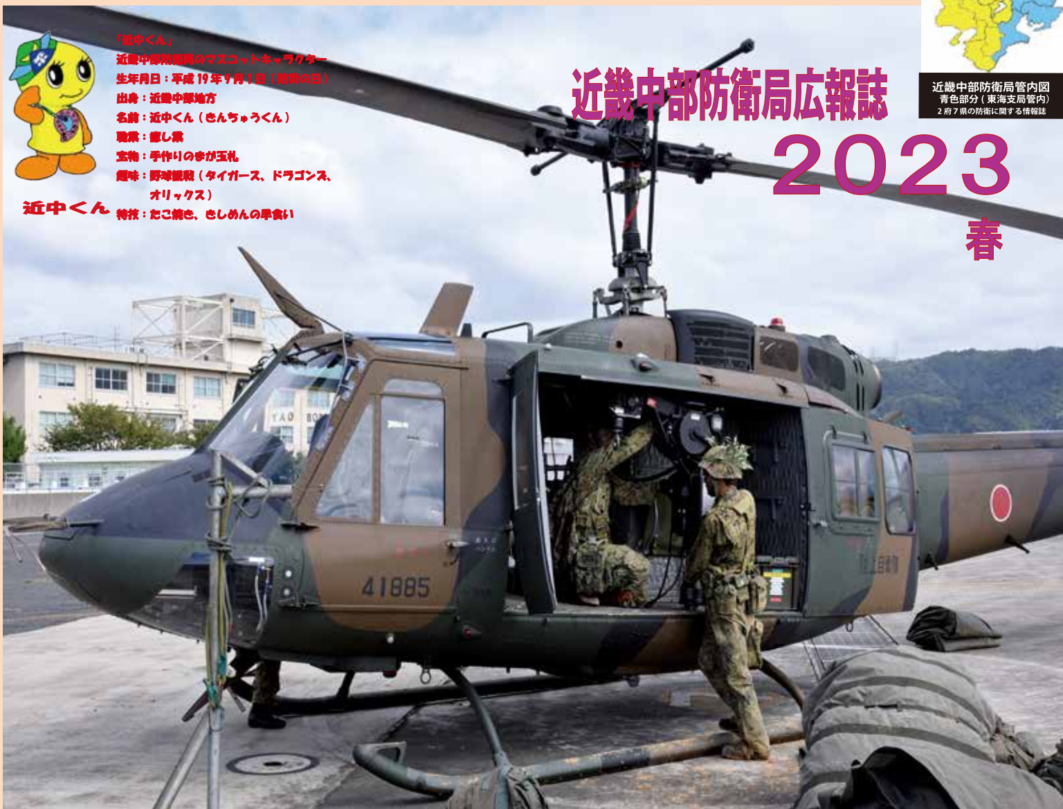
災害派遣の準備