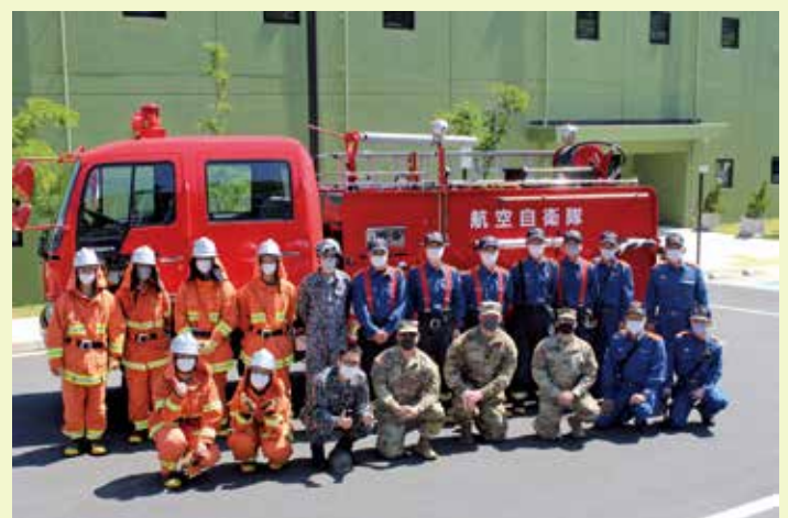
経ヶ岬通信所での消防訓練