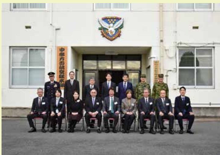
本部庁舎前にて委員等集合写真

今回の審議会においては、新たに就任された委員の方が多くこともあり、当局及び東海防衛支局の概況及び本審議会の役割などについて説明を行った後、「饗庭野演習場保安用地借り上げの現状と今後の対応」について説明を行いました。また、中部方面航空隊本部第3科長から八尾駐屯地の概況について説明を行いました。