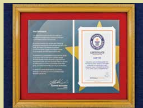
ギネス認定への協力