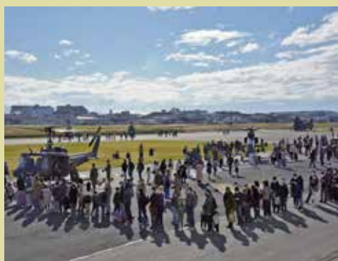
エアフェスタ（創立記念行事）