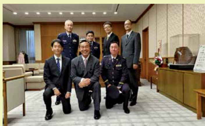
石川県知事への白書説明の様子