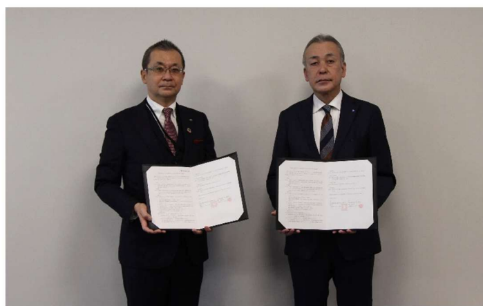
(右) 横浜市 副市長 平原敏英 (左) 東急バス 取締役社長 古川卓

横浜市と東急バス株式会社（以下「東急バス」という。）は、青葉区北西部におけるバス路線の維持・充実及び交通利便性向上に向け、令和4年1月26日に基本協定を締結しました。本協定に基づき関係者と調整を進め、事業計画を策定し、公民連携での取組を進めます。