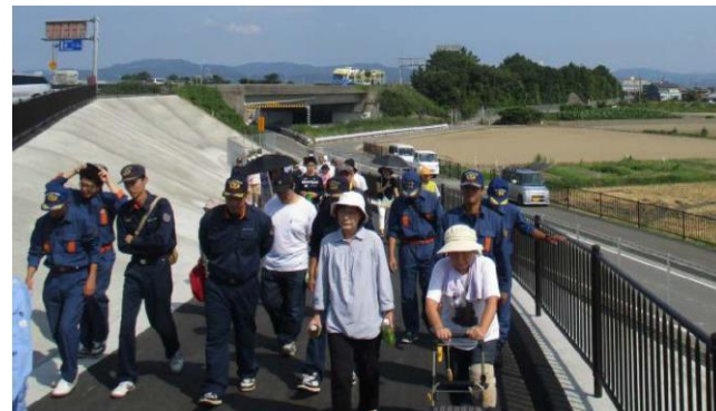
津波避難訓練の状況(H29.8.27)