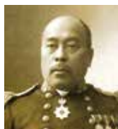
高木兼寛

明治初期に日本海軍で蔓延していた脚気の予防法を確立したのは後に海軍軍医総監となる高木兼寛でした。その時に採用されたカレー風味のシチューに小麦粉でとろみをつけたメニューが現在のカレーライスの原型になりました。海軍とともに歩んできた街・横須賀。横須賀はカレー発信の地なのです。