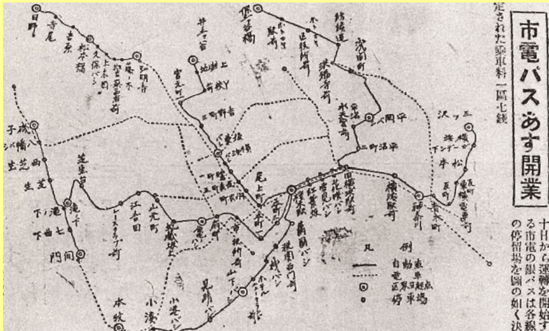
▲市営バス開業時のバス路線図 (かなしん出版／神奈川新聞社制作「のりあい自動車 よこはま市バス 80 年」より)