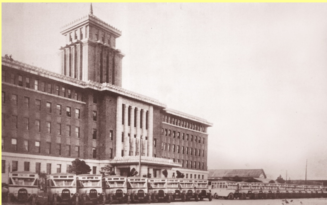
▲昭和 3 年 11 月 9 日開業の前日、車両検査のため県庁前に並んだ市営バス。