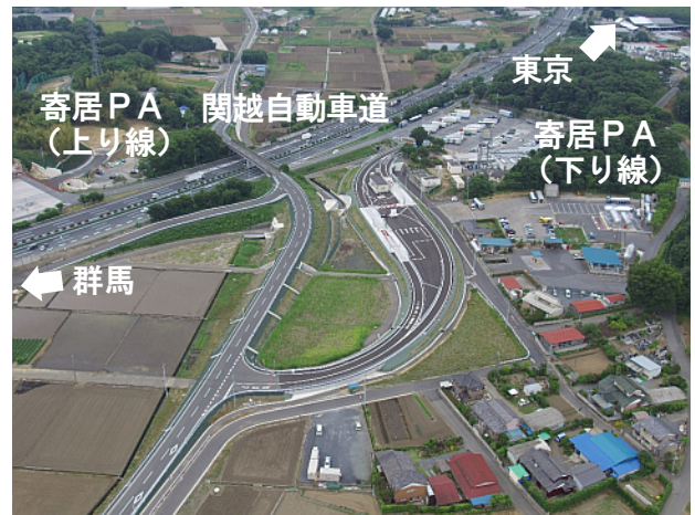
撮影日 令和2年12月中旬